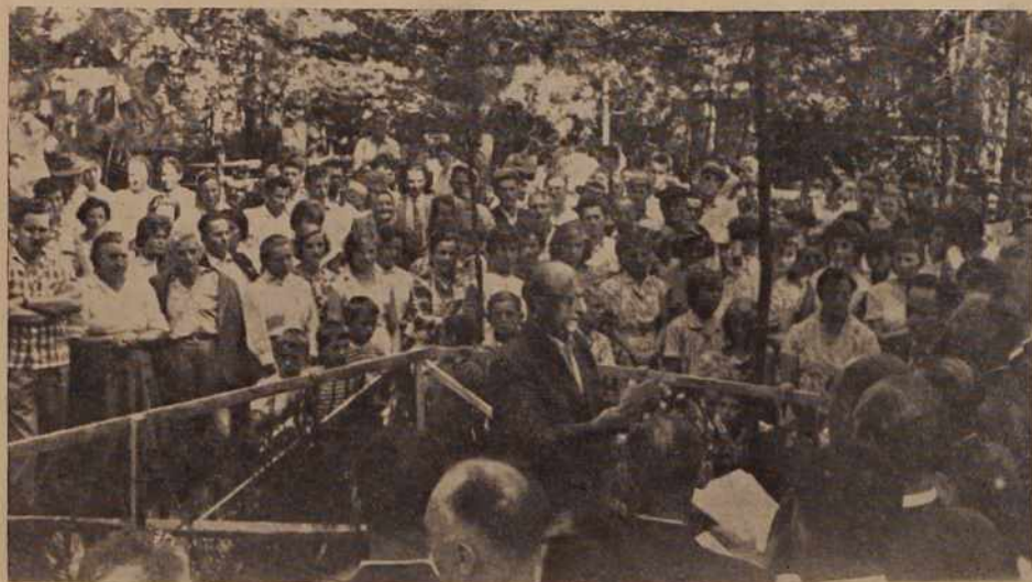
Z nedeljske proslave v Logarovcih

Za Sobotane so bile nedeljske motorne dirke pravo doživetje. Tudi naša slika kaže, da so iskali ljubitelji tega športa različne perspektive.