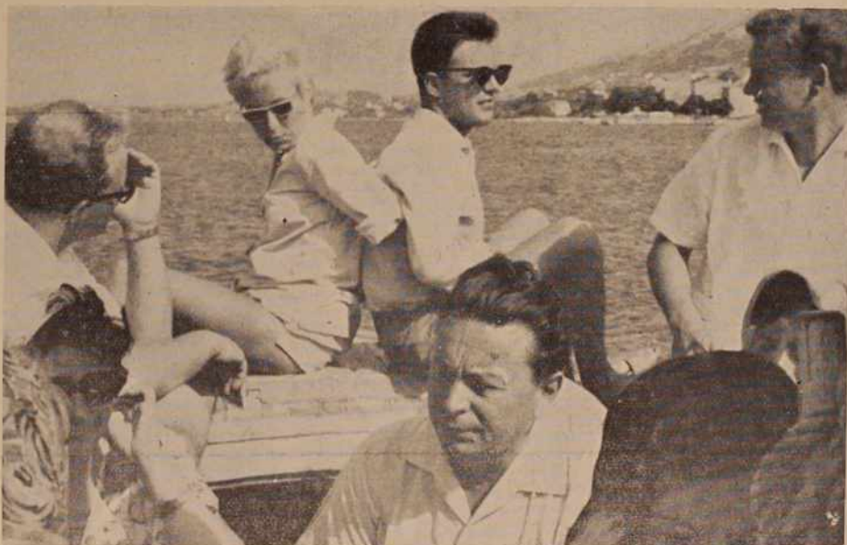
Na relaciji Rab-Barbat (več berite na 5. strani)

Organizatorji Mariborskega tedna zatrjujejo, da je precejšnje število obiskovalcev privabila modna revija, na kateri so mariborski krojači prikazali vrsto praktičnih poletnih modelov iz blaga, izdelanega v domači tekstilni industriji. Modno revijo si je ogledalo nad 10.000 ljudi, precej pa jih je moralo zaradi pomanjkanja prostora ostati zunaj.