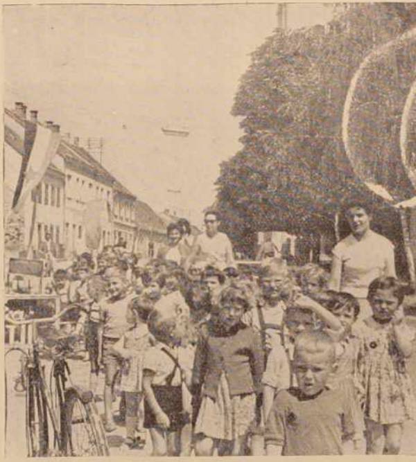
Poletni motivi iz Lendave. Se malo in šole bodo odprle svoja vrata, pa bodo ceste spet oživele.