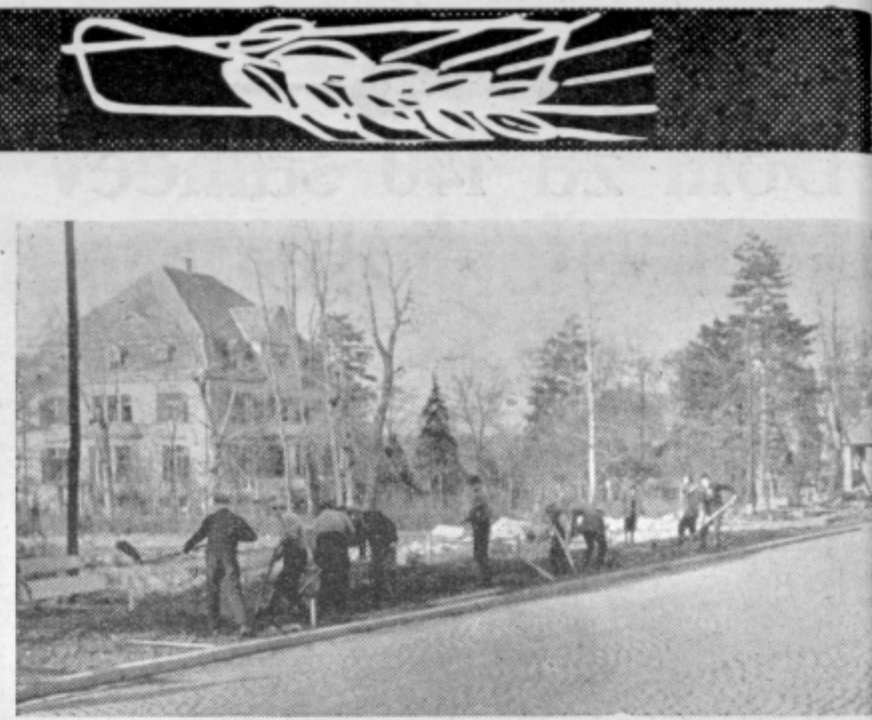
Prostovoljci na Mariborski cesti... Mladina Tovarne emajlirane posode, pa tudi drugi delovni ljudje iz Gaberij že več tednov s prostovoljnimi delom razširjajo cestišče na Mariborski cesti. Odkopna dela bodo v kratkem končana, potem pa bodo začeli betonirati kolesarske steze.

Društvo je vključena prvenstveno šolska in študentska mladina ter bo v bodoče moralo večjo pozornost posvetiti vključevanju delavske in kmečke mladine, ki je vključena v zelo majhnem številu.