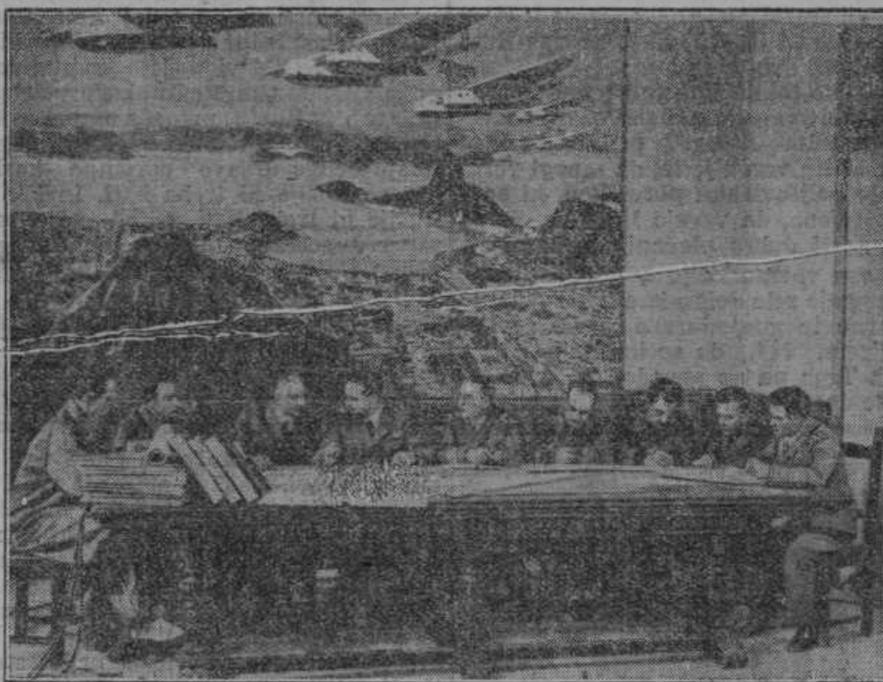
Italijani se pripravljajo na drugi prelet Atlantskega oceana z bojnimi letali. Minister za letalstvo Balbo se posvetuje s poveljniki letal. V ozadju je videti sliko prvega preleta.

In res je čudno, da se je vzdignil tak krik po svetovnih mestih, ker se nekaj tisoč Judom godi krivica, ne da bi se prelivala njihova kri. In kaj se je godilo v Rusiji? Velikim posestnikom so takoj vzeli vse imetje in vse premoženje. Vse, ki so bili carski vladi naklonjeni, so brezobzirno umorili. Na stotisoče ljudi vseh stanov so na tak način brez vsake sodnijske preiskave zaprli in brez vsake obsodbe umorili. V prostorih »krajevnih Ček« so po noči klali ljudi kot živino v mesnici. Navadno so uboge žrtve eno noč iskali in jih skupaj gonili, drugo noč pa so jih klali. Druge so obsodili na prisilno delo v severni Rusiji ali v Sibiriji, kjer so vsled pomanjkanja umirali počasne smrti. Ob enem so uničevali znamenite zasebne