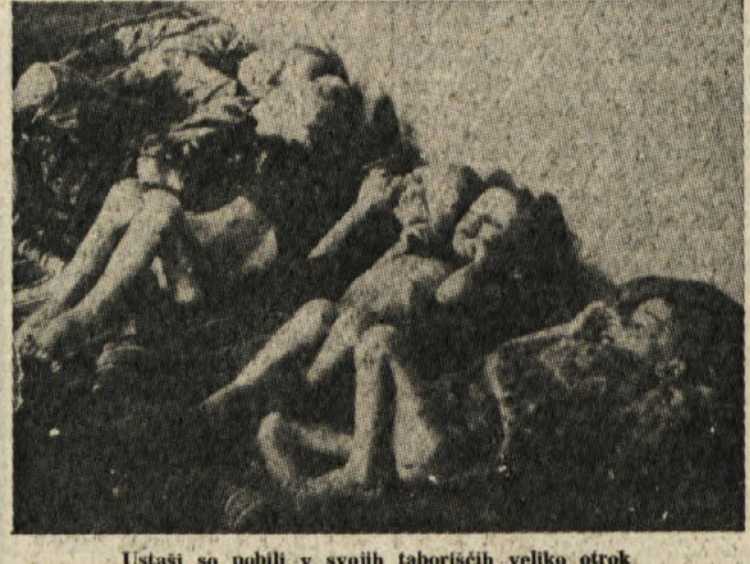
Ustasi so pobili v svojih taboriščih veliko otrok

grmeča. Čeprav smo bili že proti koncu oktobra, nas je ujela prava poletna nevihta. Med nepretrganim bliskanjem in grmenjem se je ujela tako močna ploha, da smo bili v trenutku do kože premočeni. Že utrujen od dolgega pohoda, nas je moča do kraja izčrpala. Vlekli smo se počasi, med hojo dremali in premišljevali, kako bomo premagali zadnjo oviro. Če smo se le za trenutek ustavili, smo brž zaspali. Nismo pa smeli dolgo počivati, kajti blizal se je dan in nahajali smo se blizu sovražnikovih položajev. Vzpodbujali smo borce in sebe k hitrejšemu koraku. Ko smo se blizali fronti, se je začelo svitati. Zaradi utrujenosti in moče nam je upočasnjena hoja vzela čas in zato smo