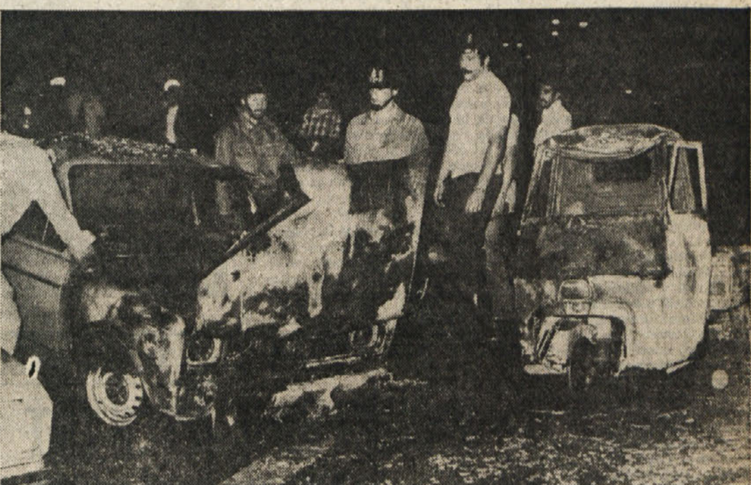
Skupina fašistov je v noči med ponedeljkom in torkom zažgala »ape« pred deželnim sedežem RAI v Ulici Fabio Severo v Trstu. Ognjeni zubli so poškodovali pročelje poslopja in zajeli še dva druga avtomobila. Škoda je za več kot 10 milijonov lir. Ves demokratski Trst je ostro obsodil provokacijo. O atentatu poročamo obširneje na tržaški strani