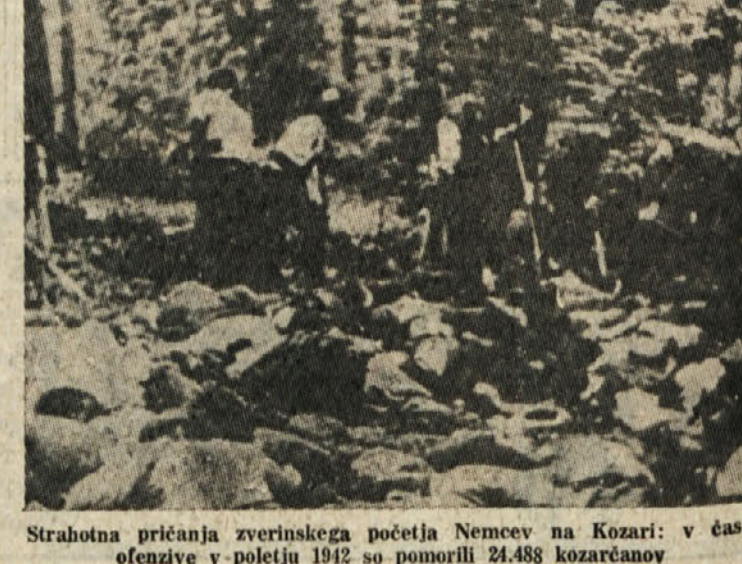
Strahotna pričanja zvernskega početja Nemcev na Kozari: v času ofenzive v poletju 1942 so pomorili 21.488 kozarčanov

zato ne bodo upali napasti. Ko bodo videli, da tudi mi nimamo teh namenov, nas bodo verjetno raje pustili skozi. Tako se je tudi zgodilo. Pozneje smo zvedeli, da so nas ljudje našli 11.500. Ne vem, kako so prišli do te desetkrat večje številke! Ljudsko pretiravanje je pač presenetljivo. Če bi tudi domobranci slišali za to številko, potem bi lahko šli skozi sovražnikovo črto mahajoč z zastavo.