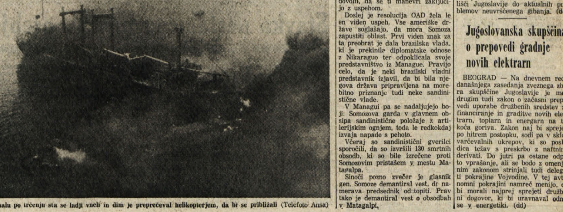
Kmalu po trčenju sta se ladji vneli in dim je preprečeval helikopterjem, da bi se približali (Teletelo ANSA)

Do nesreče je prišlo ob 5.45 zjutraj na Tirenskem morju, kakih 15 milj od obale med Miumicinom in Civitavecchio. Od tisti uri je bila na vsem območju srednje Italije izredno gosta megla (tudi rimsko letališče Gostia megla je bilo več ur zaprt za promet), ki je bila verjetno glavni vzrok nesreče. Vse kaže, da je kapitan italijanske ladje pravčasno opazil nevarnost in spremenil smer, vendar pa je njegov francoski kolega naredil isto. Trčenje je bilo silovito. Francoska ladja se je silem zvrnila v levi bok.