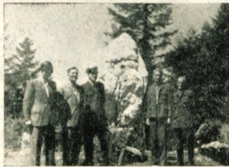
Spomenik pod Storžičem padlim borecem

II. bataljon je v tem času znatno pomnožil svoje vrste. Številčno najmočnejše se je okrepila II. četa, ki je štela po mobilizaciji domačinov 50 mož. Mobilizacija je bila izvršena v Stranjah, Sidražu, Ambrožu