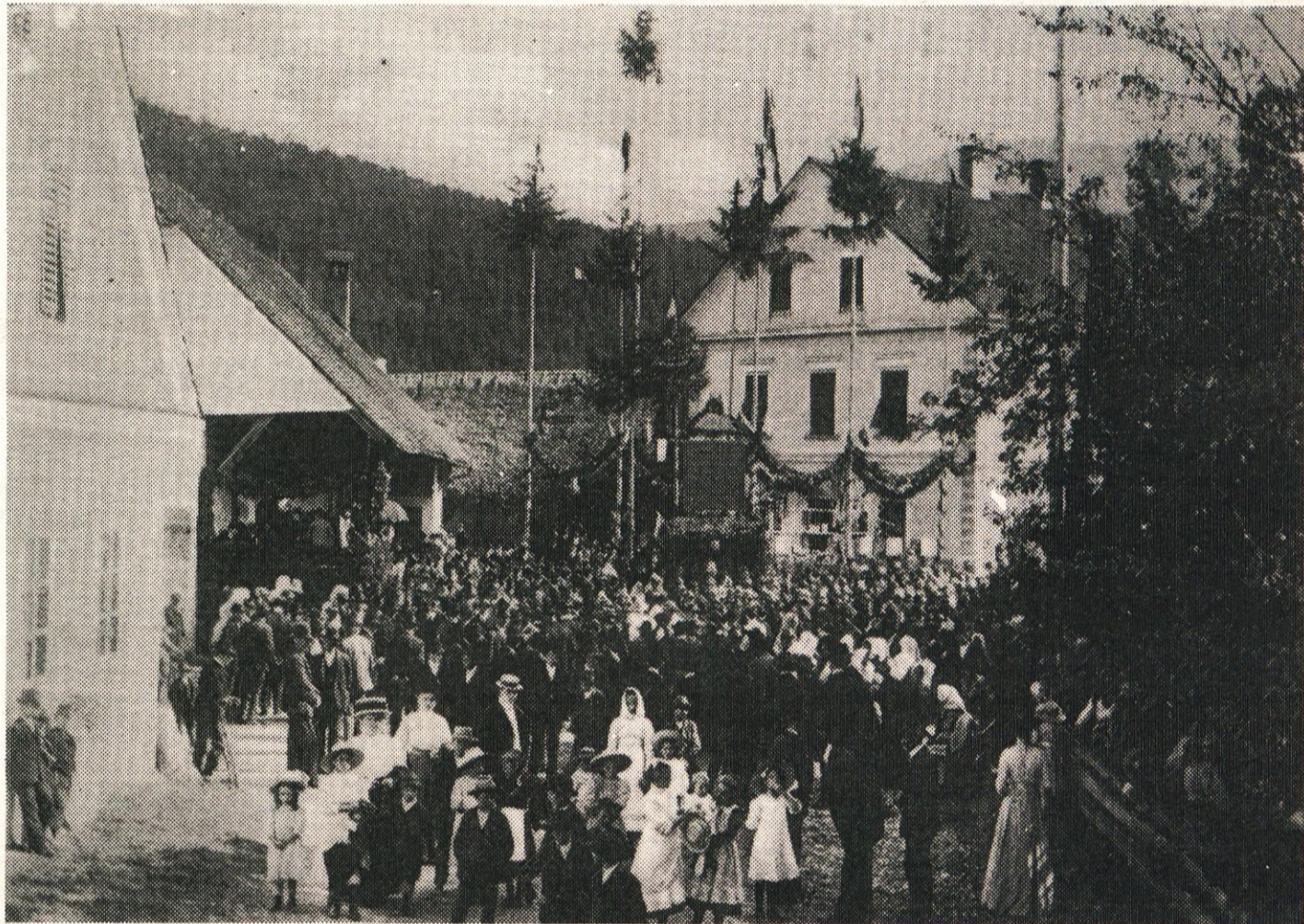
Na slika: Veselica v Verdu leta 1910

Več o praznovanju na 2. in 3. strani, kjer so predstavljeni tudi občinski nagrajenci.