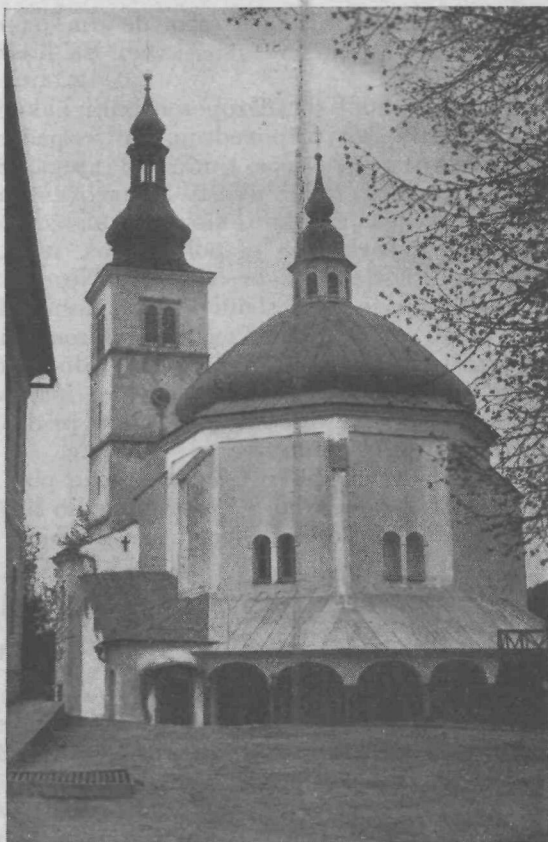
Cerkev pri Novi Štifti