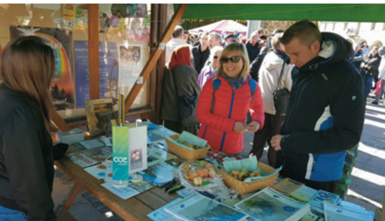
Logaški paviljon na gregorjevem semnju

Soorganizatorja semnja, Občina Logatec in Komunalno podjetje Logatec, sta vnovič poskrbela za bogat spremljevalni program, kjer so se predstavila domača kulturna in turistična društva, med njimi tudi (naš) hišni pevski zbor OMePZ »Notranjska«.