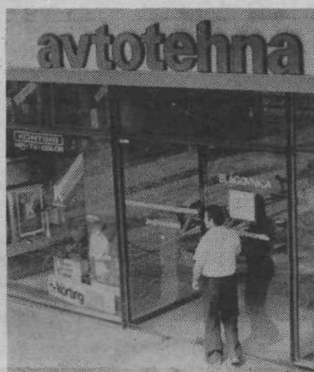
V Avtotehni so se resno zavzeli, da bodo uredili razmere in se prilagodili novim pogojem najkasneje do konca leta