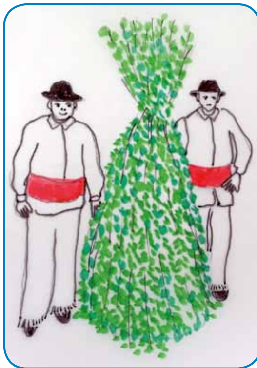
V Bejloj krajini so na djürovo ojldi »jurjevat« trgé podje – ednoga so od glavé do peté naravnali v zelenjé: un je biu Zeleni Jurij

bila, so gi jurjaši zaželejli dosta lagvoga (»aj vam živina zgine pa aj kleti več nede vašoga roda pri tom rami«). Podje so prvo nedelo po djürovim napravili gostüvanje, kama so pozvali svoje pa-