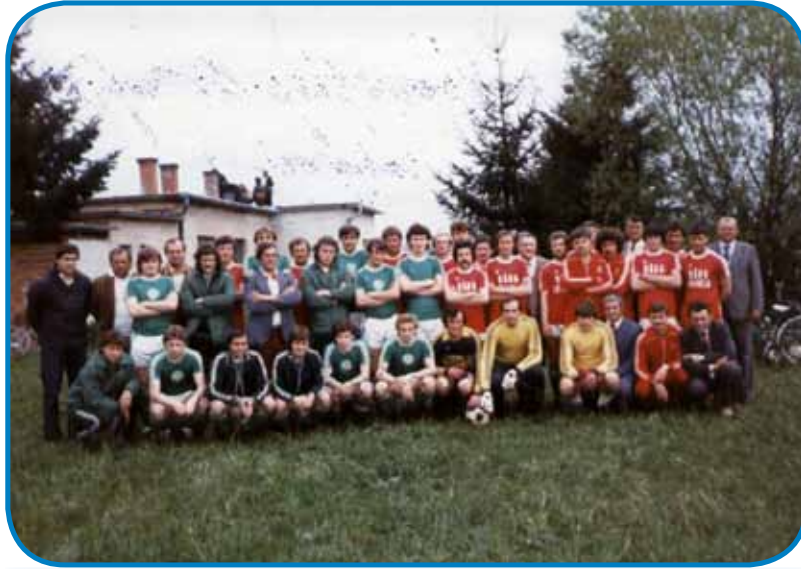
Slovenčarska nogometna ekipa je tistoga ipa špilala s Fradinom pa Haladásom tö.

- Demo malo nazaj, kama si üšo delat, gda si zgotau-