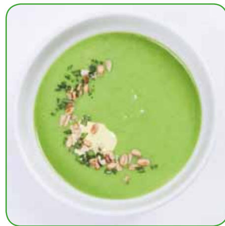
Koprivna juha

Zdravilnost kopriv je torej znana že od davnine, so zastoj in rastejo za skoraj vsako hišo. Zdravilni in uporabni so vsi deli rastline, listi, steblo, korenine in semena. Najboljše koprive za nabiranje in uživanje so spomladi, ko začnejo poganjati mlade rastlinice. Naši predniki so zelo cenili koprivni čaj iz posušenih ali svežih kopriv. Priprava je preprosta. Zavremo liter vode, ga odstavimo in poto-