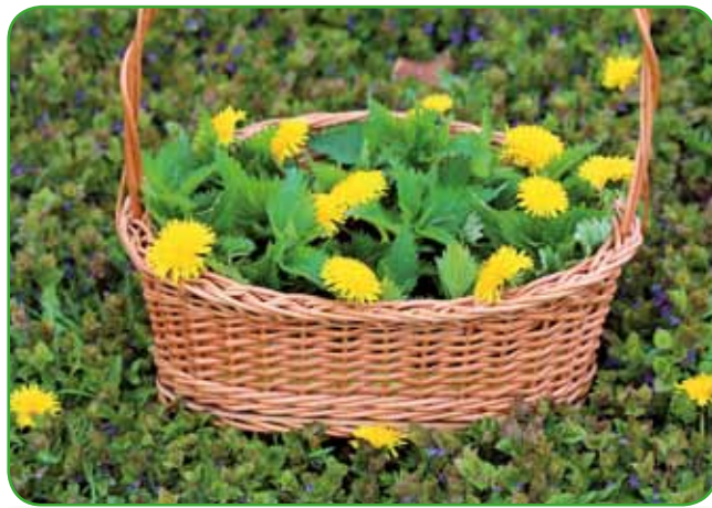
Koprivni vršički in regratovi cvetovi

Hrana iz narave je med ljubitelji kulinarčnih posebnosti vedno bolj priljubljena, pomlad pa pravi čas za nabiranje divjih rastlin. Če smo v predhodnih prispevkih spoznavali čemaž in regrat,