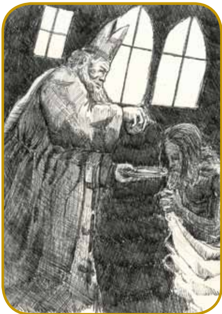
Sveti Adalbert je na Vogrskom oznanjo evangelij že pred letom 1000 - un je po legendi okrsto in férmo svetoga krala Števana (Vajka)

Vojteh se je naraudo kauli leta 955 na Češkom, ime