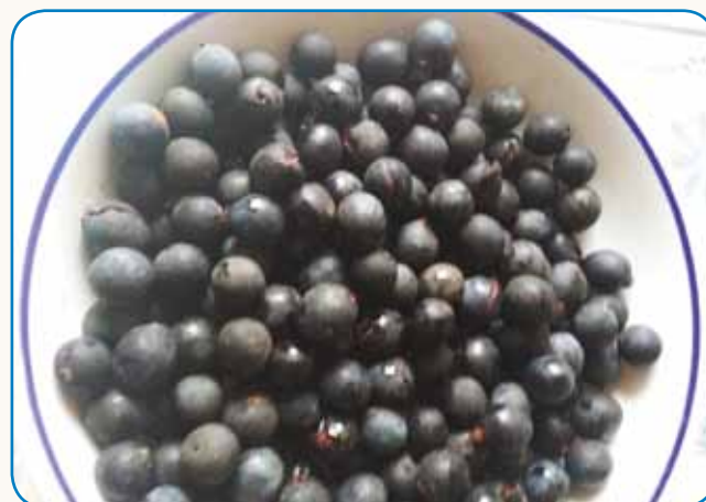
Ka vse leko naredimo iz trnine? stran 7