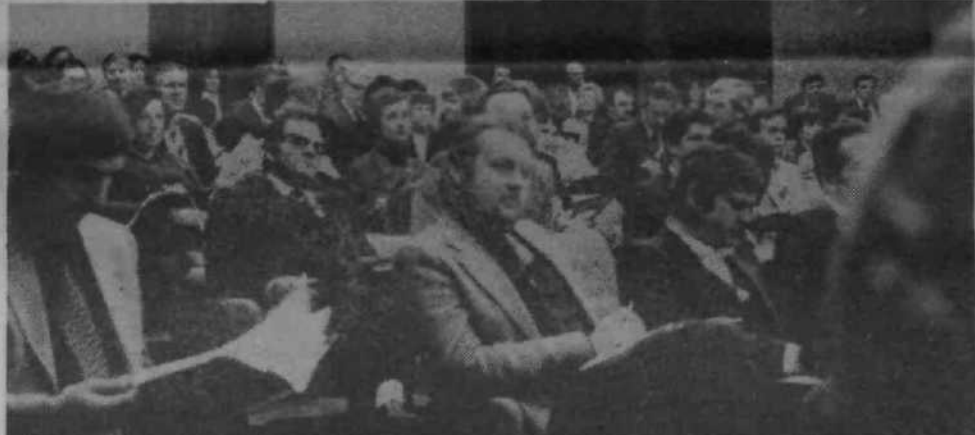
S srečanja organizatorjev obveščanja v združenem delu.