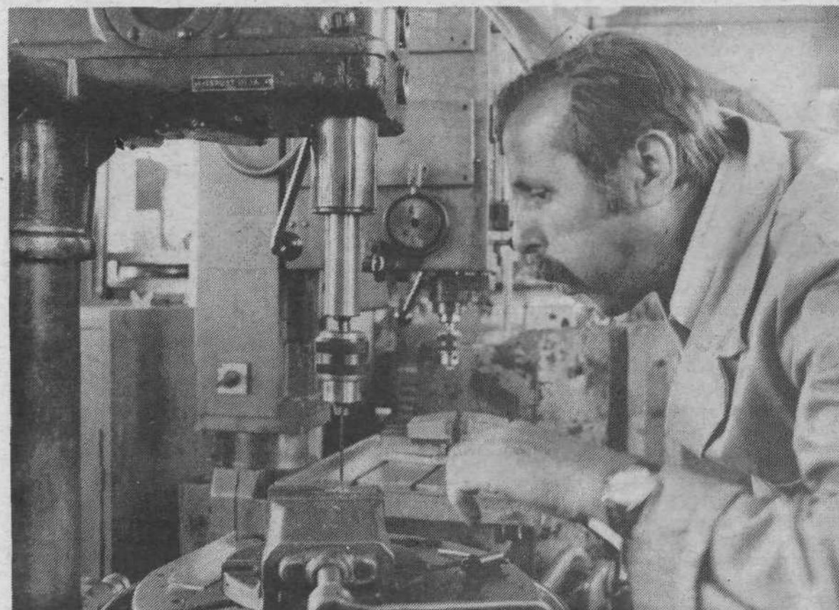
Kovinarski poklic zahteva veliko preciznosti in natančnosti, predvsem pa veliko praktičnega dela.