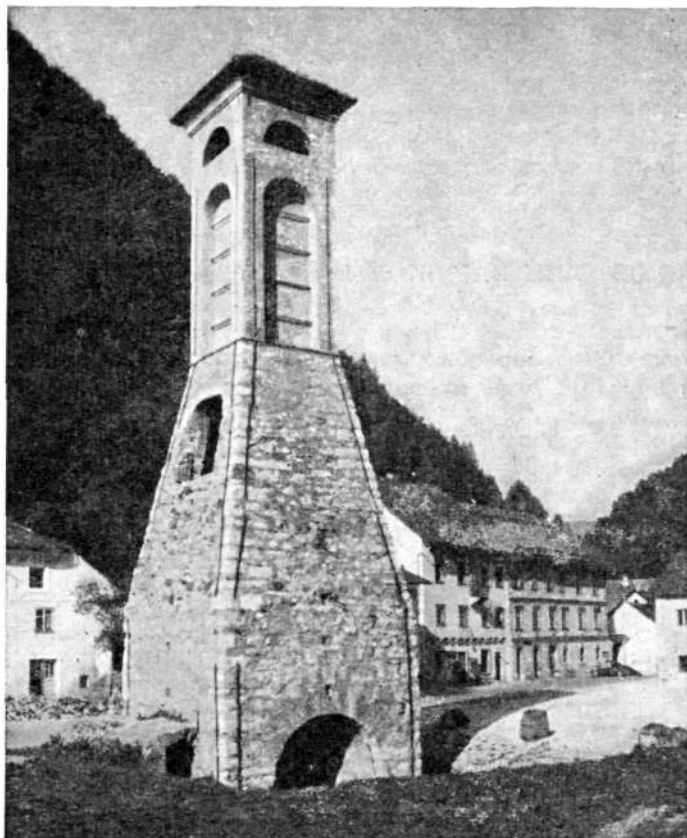
Plavž v Zgornjih Železnikih. (Iz: F. Planina, Skofja Loka s Poljansko in Selsko dolino, 1972, 159.)

Vigenjcev je bilo še 17, in sicer 8 v Zgornjih in 9 v Spodnjih Železnikih: