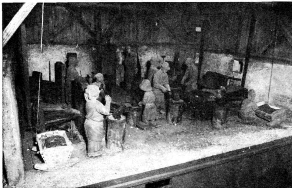
Maketa vigenjca v muzejski zbirki v Železnikih. (Iz: F. Planina, Skofja Loka s Poljansko in Selško dolino, 1972, 160.)

Kljunovo prošnjo v imenu 15 kovačev in 20 kovačic so fužinarji, predvsem Globočniki, sprejeli ko »sumljivo gibanje«, zato so kaplana zavrnil, naj se briga za cerkvene zadeve in zadeve bralnega društva, v obrtne razmere naj se pa ne vtika, »ker to ne spada v njegovo področje, temveč v one delavcev samih in njih gospodov«. Iz majhnega števila podpisnikov — v Železnikih je bilo tedaj nad 250 kovačev — je sklepati, da Kljun pri svoji prošnji niti med kovači ni imel dovolj opore. Še tisti, ki so podpisali, so verjetno podpisali zato, ker sta bila dva dni pred izročitvijo prošnje kaplan in župnik pri J. Globočniku in ga vprašala, če fužinarji morda ne nasprotujejo temu, da se odpravi nočno delo in vpelje red. Kovači se namreč niso upali prošnje podpisati, preden niso vedeli za voljo svojih gospodov.