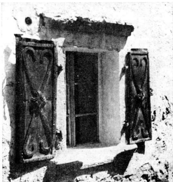
Železniki: Okno iz starih kovaških časov. (Iz: F. Planina, Skofja Loka s Poljansko in Selško dolino, 1972, 161.)

Zadnje občinske volitve v našem trgu so dale gotovim krogom povod, da so začeli z veliko strastjo napadati v javnosti naše fužinarje, češ da so oni prvi,