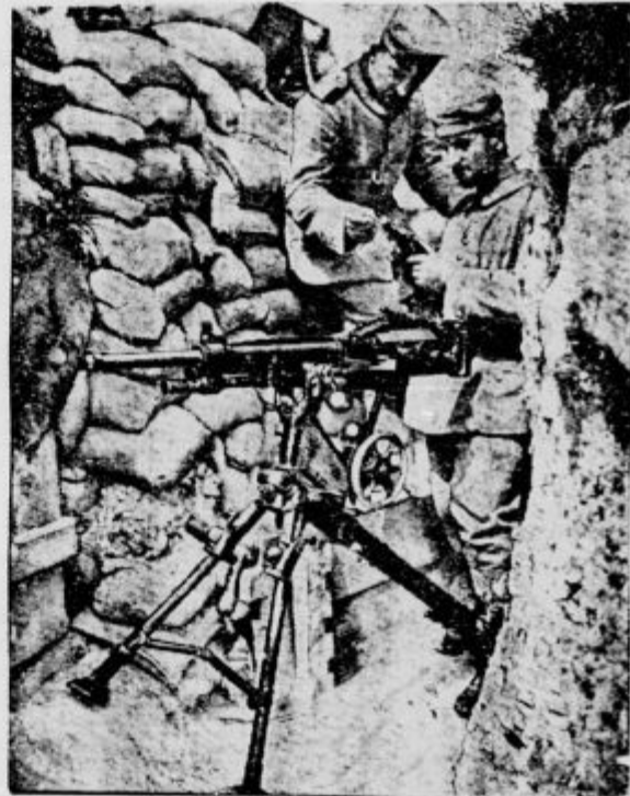
Preskušnja uplenjene strojne puške.

Bila je srečna misel, da se slovensko ljudstvo, ki se po pravici lahko imenuje »Marijino ljudstvo«, v teh hudih časih pokloni nebeški Materi tudi na onem kraju, v onem svetišču, kjer še prav posebno uslišuje zaupljive prošnje vernih romarjev — na Brezjah. Imeli smo v Ljubljani in drugod po naši lepi domovini že obilo prošenjskih dni in pobožnosti v namen naše vojske in ne brez vidnih uspehov. Blagoslov božji ni izostal. Vsi moramo priznati, kako očitvidno Bog varuje našo ljubo Avstrijo, koliko nepričakovanih zmag nam je že naklonila božja previdnost. Toda stiska še ni pri kraju. Verolomni Italijan je hotel na vsak način svojemu »Viktorju« za god podariti Gorico in