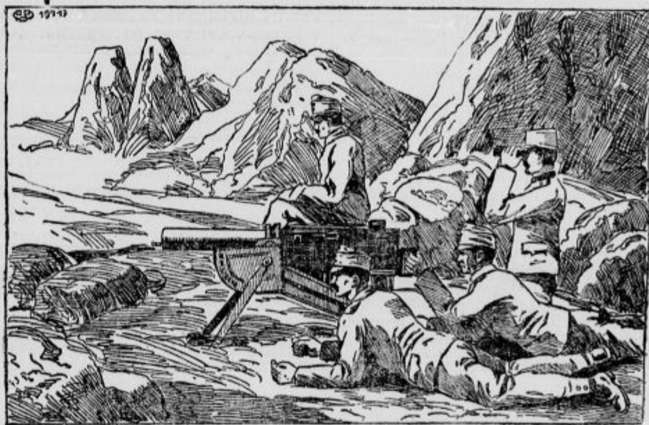
Oddelek avstrijskih strojnih pušk na Krnu.

Železnica Malkin — Sjedlce zasedena. Narevska skupina je prekoračila reko Bug in se polastila železniške proge, ki vodi v Sjedlice, glavno mesto istoimenske gubernije med Vislo in Buгом. Te čete so dobile stik z armado bavarskega princa, ki je že dosegel omenjeno mesto. Ozemlje, kjer prodirajo sedaj skupne naše čete, je že deloma močvirno. Prav tako otežuje delovanje narevske skupine močvirje ob spodnjem teku Nareve.