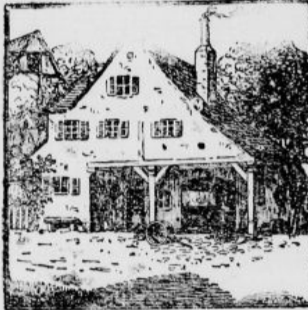
Kje je kovač?