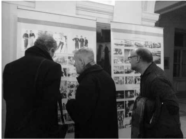
Gledalci ob odprtju razstave

Ta pripadnost skupnemu dobremu je prišla najbolj do izraza v času osamosvajanja Slovenije, ko so Slovenci v Argentini lahko javno zagovarjali svojo skupno pripadnost slovenskemu narodu in se z vsemi svojimi močmi, spretnostmi in zvezami trudili in dosegli, da je Argentina med prvimi priznala