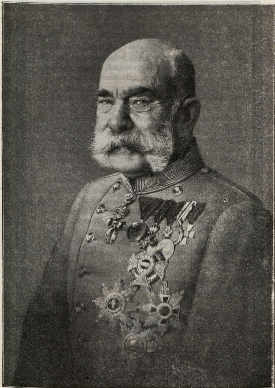
† Cesar Franc Jožef I.