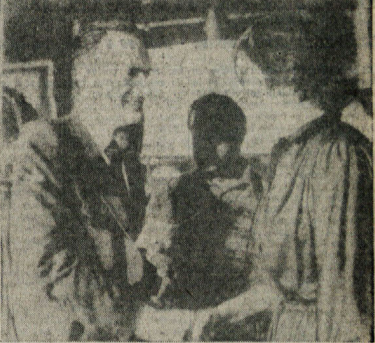
Med obiskom: tajnika KD v Združenih državah, Zaccagnini se rokuje z italo-ameriško predstavnico.

Istoačasno pa komunisti ne smejo v vlado, nadaljuje Zaccagnini, ker men, da morajo prehoditi še dolgo pot, če hočejo biti sprejemljivi. Pogoji zato pa so, po Zaccagninjevem mnenju, sprejetje zadobne kulture in sistema demokracije, vključno s trdnim gospodarstvom in opuščanje marksistično-leninističnih značilnosti. V tem okviru je Zaccagnini poudaril interes KD za polemike socialistov proti komunistom. (sts.)