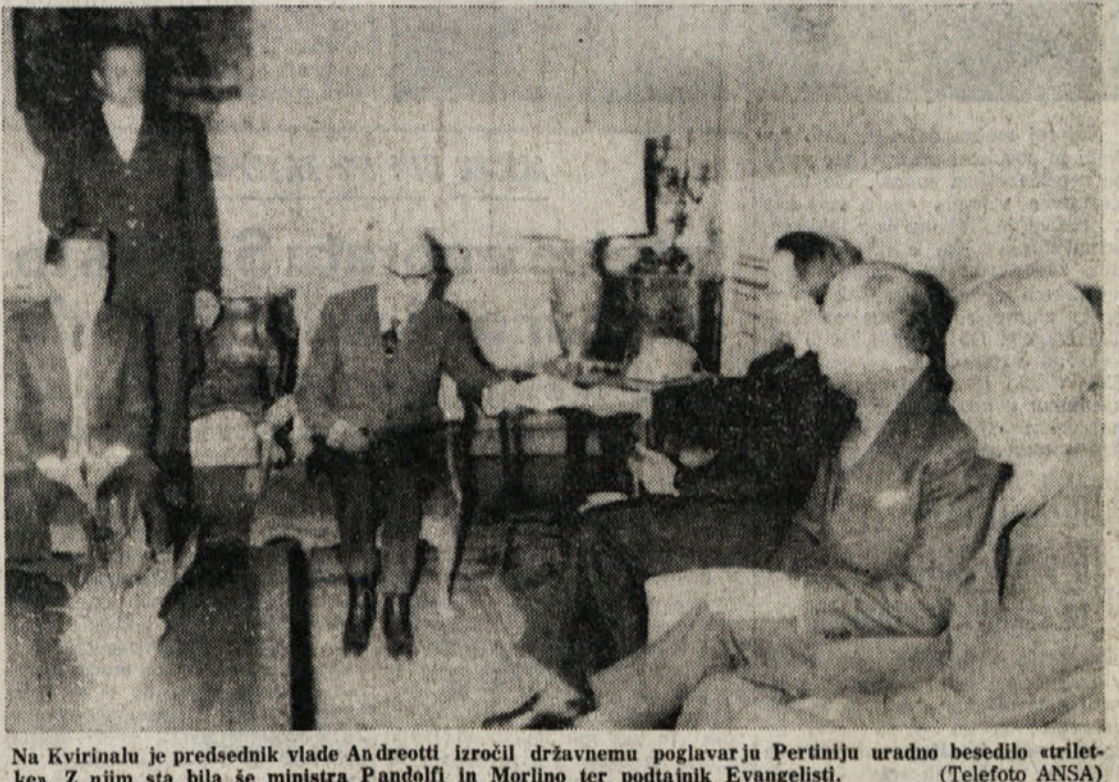
Na Kvirinalu je predsednik vlade Andreotti izročil državnemu poglavarju Pertiniju uradno besedilo «triletke». Z njim sta bila še ministra Pandolfi in Morlino ter podtajnik Evangelisti.

RIM — Predsednik vlade je sodelavci predstavil vsem uradnim organom republike triletni gospodarski načrt, ki je prejel ime po finančnem ministru Pandolfiju. Dokument je izročil na Kvirinalu predsedniku republike Pertiniju, na Montecitorioju predsedniku zbornice Ingrassi in predsedniku senata Fanfaniju v palači Madama. Pri tem pa je razdelil na desno in levo dalje izjave, v katerih je poudarjal predvsem dvoje: da je «triletka» plod skupnih naporov vseh večinskih sil in torej edini možni kompromis za vladno večino, po drugi strani pa obljubljal, da ga je mogoče tudi spremeniti ali izboljšati, le pod pogojem, da se spor ne dotakne osnovnih ciljev, glede katerih poudarja, da ni drugih izbir.