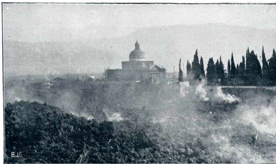
IZBRUH ETNE: ŽAREČA LAVA PRODIRA V VASI