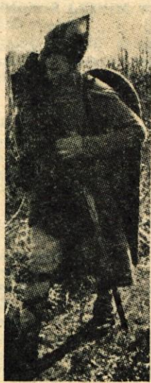
»Ne, hvala, dovolj,« je rekel moderni vitez, ki je zadnji prispel na cilj

Res so se ustavili pri „Jarmu“. Privezali so konje in se znesli v gostilno. V krčmi je bil ples, purgarska maškarada je napolnila vse prostore. Kamnogoričani so razrinili plesalce vsaksebi, se polastili največje mize in zavpili, naj jim gostilničar prinese vina, na vsak mizni vogal štefan. Pili so in nekaj časa se je zdelo, da bodo veseljačili skupaj z domačini. Potem pa je eden pod krinko prepoznal Španovega Johana in se začel norčevati: