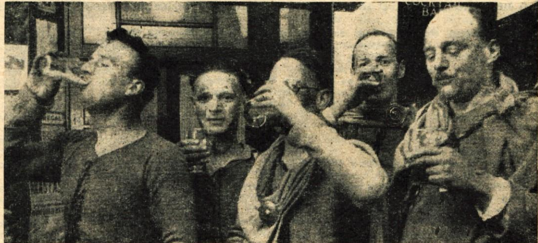
Nedavno se je pet članov nekega angleškega kluba za »hodilni šport« odpravilo na svojevrstno pot: namenili so se prehoditi vseh dvesto milj, ki so jih angleški vitezi prehodili leta 1066, ko so hiteli na bojišče pri Hastingsu, kjer jih je potem premagal William Osvajalec in osvojil Anglijo. Ni znano, koliko časa je trajal ta ogromni pohod; nekateri pravijo, da štiri, drugi sedem, večina pa deset dni. Športniki so se odločili za deset dni. Obkleli so se v opremo iz leta 1066, si naložili ščite, meče in sulce — ampak že po prvem dnevu so bili toliko utrujeni, da niso več mogli naprej. »Ni čudno, da so Saksonci kralja Harolda izgubili tisto bitko,« pravijo na to angleški časopisi — Po napornem pohodu (zgoraj)