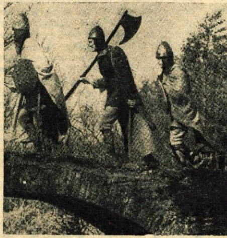
V začetku je se kar šlo (zgoraj), ampak železna srajca, ščit in orožje niso lahke reči... (spodaj)