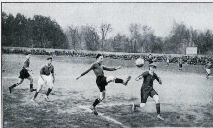
Moment iz tekme Hašk – Sparta, Zagreb.

Nogometna sezona v Mariboru je v normalnem razvoju. V nedeljo so se igrale na igrišču Maribora prve prvenstvene tekme, pred temi so imeli klubi več prijateljskih tekem. Mariborski pododbor L. N. P. je prevzel vodstvo z veliko ambicijo, očitno se mu bo posrečilo odpraviti nedostatke iz lanske sezone.