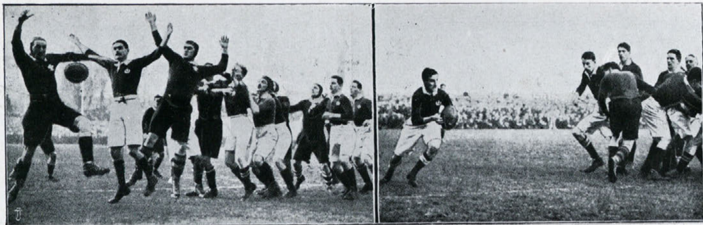
Rugby-igra med Škotsko in Walesom.

V koliki meri pa učinkuje telesno udejstvovanje na r a z u m? Telesna lenoba je vir vsega zla; naši vtisi se redkokdaj obnove; radi ostajamo doma v temotnem, enoličnem razpoloženju; brez upora se prepustimo dolgočasju in nevolji; so trenutki, ko vlada v nas zver. Vse strasti se razpasejo in človek se jim prepusti, ne da bi znal, kako. To so trenutki, ko zamre trezna misel, ko rapidno slabi razumevanje. To žaslostno stanje nastaja vsled počasnosti fizičnega življenja, od počasnosti, s katero se vzbujajo ideje, od popolnega pomanjkanja zunanjih vtisov. To pa se odstrani s preprostimi telesnimi vajami. Zato moramo v celem obsegu priznati vpliv telesnega gibanja na naše zmožnosti.