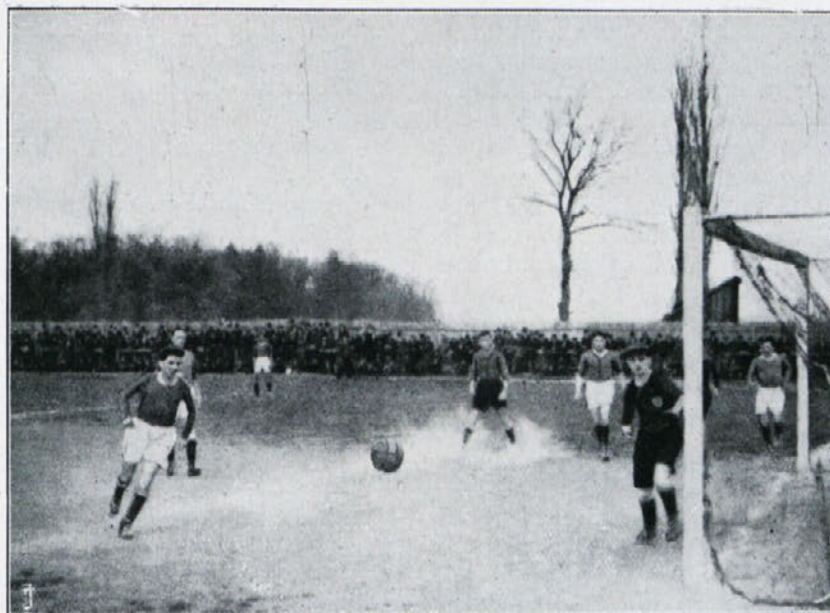
Moment iz tekme Hašk – Sparta, Zagreb.