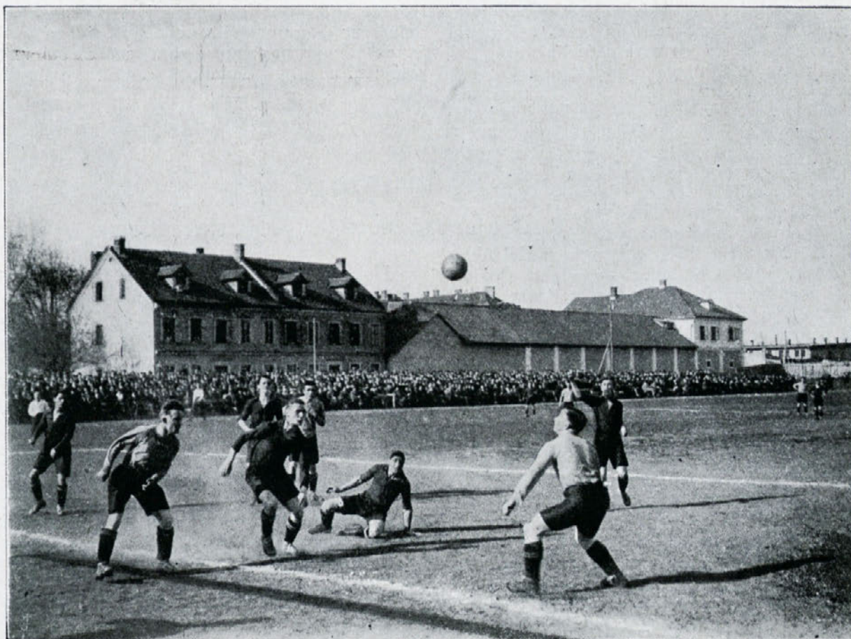
Tekma Gradjanski Š. K. — Ilirija.

Pravo preizkušnjo svoje kvalitete je imel prestatati Hajduk vsekakor šele naslednji dan. Ilirija, boljše seznanjena z igriščem in izvzemši morda dvojice