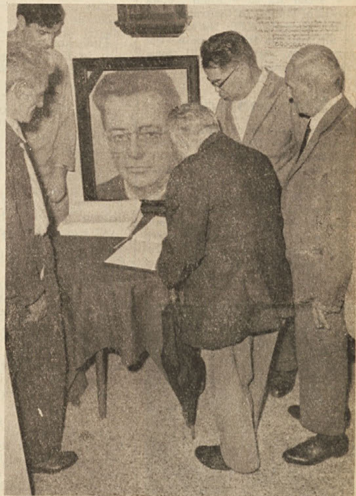
Tržaški delavci so vselej Togliattija z veseljem pozdravili v svoji sredi, zato so s tem večjo žalostjo sprejeli vest o njegovi smrti. Na sedežu tržaške federacije se delavci podpisujejo v knjigo žalosti