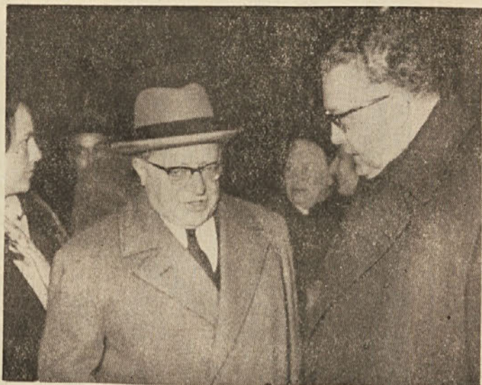
Togliatti na poti v Jugoslavijo leta 1964. Na tržaškem kolodvoru so ga pozdravili voditelji deželnega komiteja in tržaške federacije KPI, nakar je v spremstvu generalnega konzula SFRJ nadaljeval svojo pot v Beograd. To je zadnja slika Togliattija, posneta v Trstu