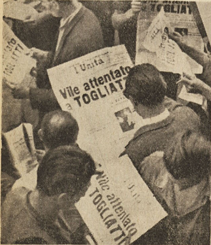
14. julija 1948 je politični nasprotnik Palante streljal na tovariša Togliattija. Atentat je bil rezultat hujskanja proti delavski stranki. Italijanski delavci so reagirali na atentat s splošno stavko