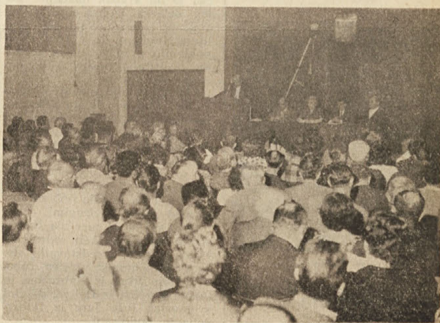
Komemoracija v Ljudskem domu v Trstu.