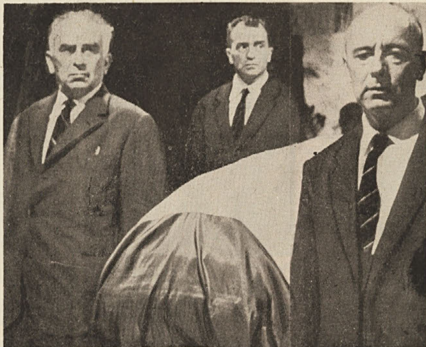
Predstavniki vodstva KPI na častni straži ob mrtvaškem odru tov. Togliattija. Prvi na levi je tov. Longo, ki je bil v sredo soglasno izvoljen za novega generalnega sekretarja KPI.

Koliko ljudi je bilo v sprevedu in koliko ljudi v špalirju, je nemogoče ugotoviti. Rimljani sami so dejali, da tako številne množice še niso videli na mestnih ulicah in trgih, izvedenci pa zagotavljajo, da se je pogreba udeležilo vsaj en milijon ljudi.