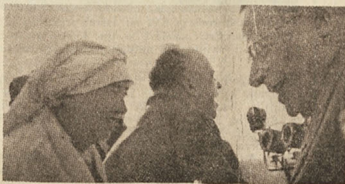
Slovenska žena iz Trsta pozdravlja tovariša Togliattija. Slika je bila posneta 1. maja 1955 na občinskem stadionu