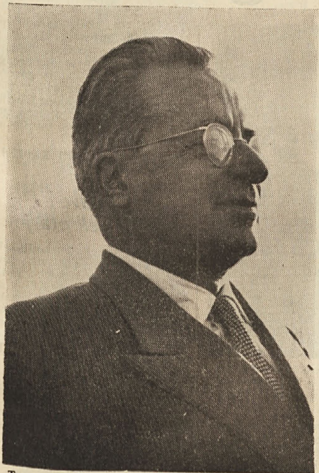
Tovariš Togliatti govori na občinskem stadionu v Trstu 1. maja 1955. V tem zgodovinskem govoru je med drugim poudaril, da je prijateljstvo z Jugoslavijo predpogoj za razvoj Trsta in njegove vloge v Evropi