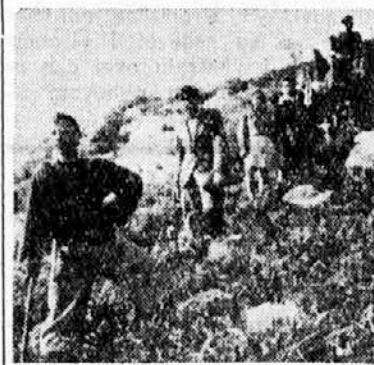
Са излета ogulinskih Sokola на Klek (1.182 м.)

Токот месеца приредено је неколико успелих излета: на »Klek«, извор »Bistraca«, Јасенак и Рибос