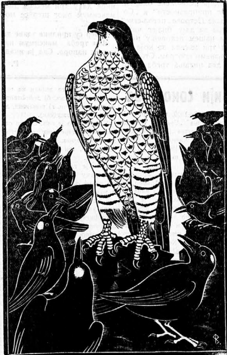
НЕ ПОБЕЖЕ НИКАД СА МЕГДАНА СИБ СОКОЛЕ ОД ЦРНИЈЕ ВРАНА

То су вечери са просветно-забавним програмом по узору на усмене новине. Ту се кратко изложене актуел-