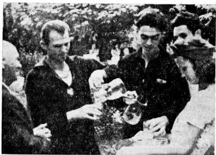
Bistra voda, bistar um

juga, drugi sa severa, da bi se time bolje upoznali.