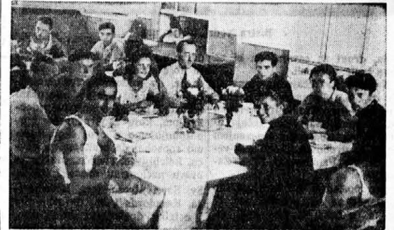
Zadovoljstvo u blago vaonici nakon rada

Ne manja važna predavanja o sokolskim tečajevima i ulozi ide-