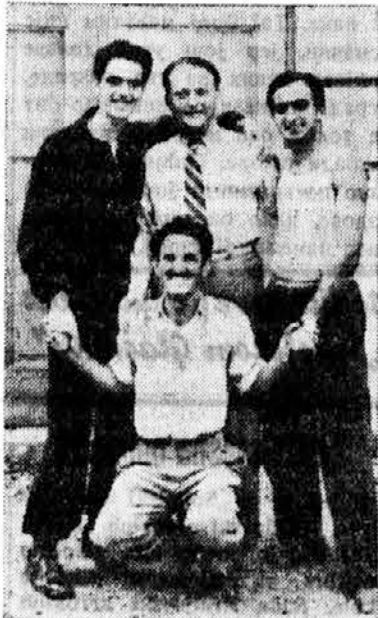
Dična Dalmacija, klasični jug i ponosna prestonica

Osobito lepo predavanje je bilo o vaspitanju naraštaja, što je brat Skovran, nesumnjivo, kao dobar vaspitač, mogao lepo i da izloži svoja zapažanja. Govoreći o našem taborovanju, brat predavač nam je tako reljefno prikazao i dokučio njegovu čar, da smo bili pod utiskom, kao da smo pod šatorima ispod neke od