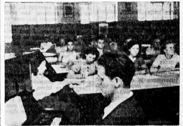
Ko peva, zlo ne misli