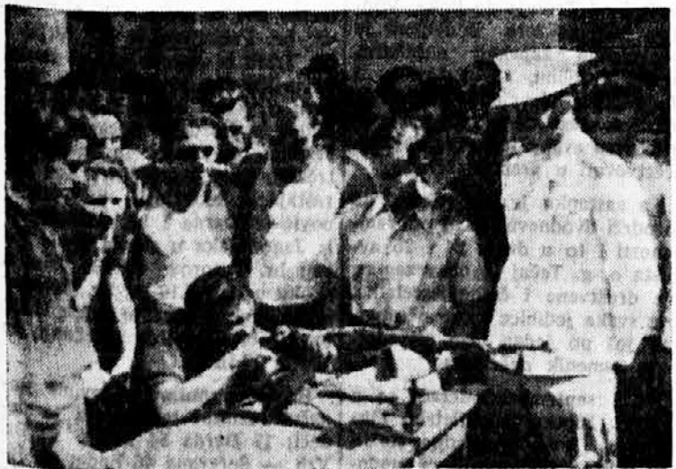
Ni nastava za gađanje nije izostala!

Pored svega ovoga, tečajci su pokazali primernu disciplinu i mnogo dobre volje, da se što više osposobe za svoje uzvišene sokolske dužnosti, koje ih očekuju u jedinicama. Lepo je bilo videti kako je vladala puna saglasnost među slušaocima, kako se ni trenutka nije pojavila ni najmanja netrpeljivost, kako su se fino razumevali i slagali u svemu oni sa severa i zapada, s onima s istoka i juga. Nesumnjivo, tome je mnogo doprinelo što su u sobama stanovali jedan sa