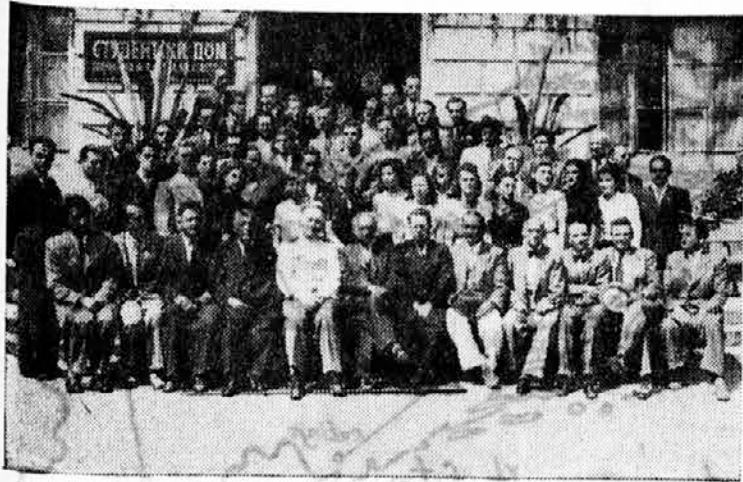
Učesnici tečaja sa nastavnicima

Za vreme trajanja tečaja, slušaoci su razgledali lovački muzej u Topčideru, Muzej kneza Pavla i Zoološki vrt.