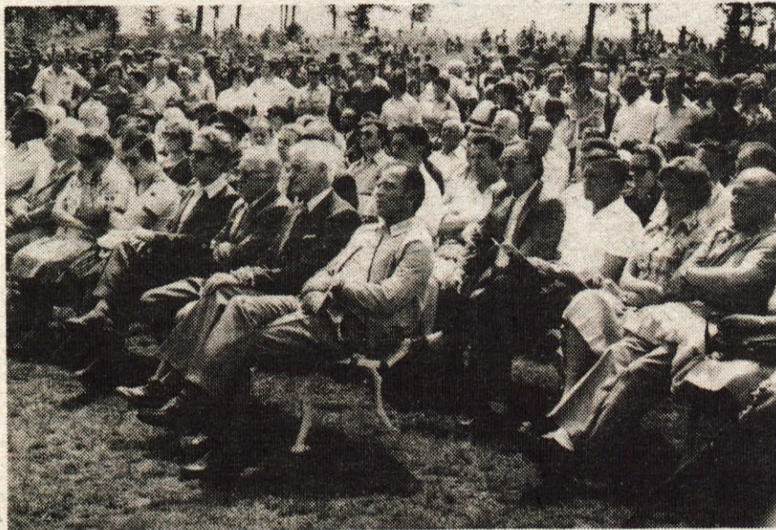
Zbora aktivistov in srečanja borcev Gorenjskega odreda so se udeležili tudi predstavniki republike in drugi.