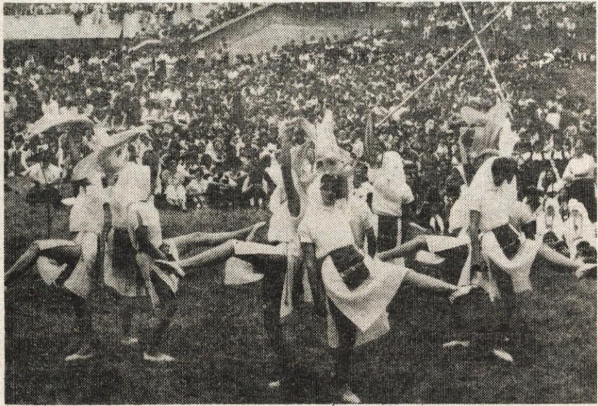
Okolica dražgoškega spomenika je v soboto zaživela v pisanem živzavu pesmi, recitacij, godbe in plesa. Na sliki so pionirke iz Smederevske Palanke. (lb)

GLASILO SOCIALISTIČNE ZVEZE DELOVNEGA LJUDSTVA ZA GORENJSKO