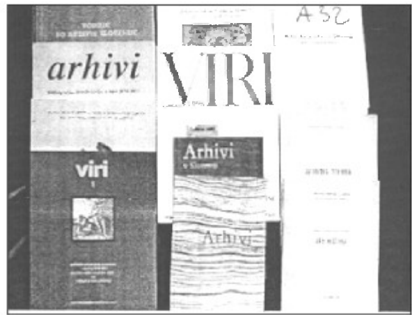
Glavne društvene publikacije