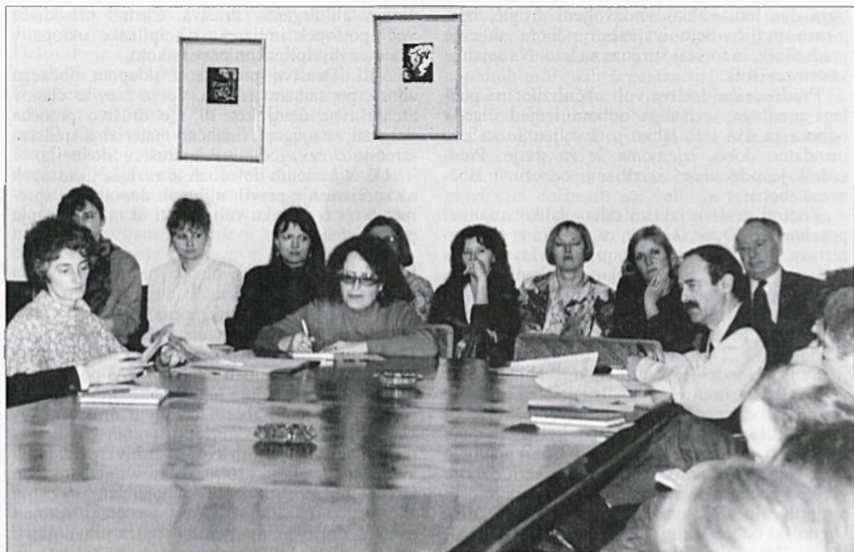
Občni zbor. Ljubljana, 2. marec 1994, AS 135, Zbirka fotografij o Arhivu Republike Slovenije in Arhivskega društva Slovenije, a. e. 15.

Za določene naloge, ki so zahtevale daljše priprave, je izvršni odbor imenoval posebne skupine ali komisije, tako za pripravo zborovanj, obravnavo problematike določenih vrst gradiva (upravni fondii, gospodarski fondii), za popis arhivskega gradiva zunaj arhivskih ustanov, za ugotavljanje načinov marketinga v arhivih ipd. V obravnavanem času je skušal oživiti tudi nekdanjo sekcijo za delavce, ki delajo z dokumentarnim gradivom, kot nekakšno strokovno skupino, a za to ni bilo dovolj zanimanja. 6