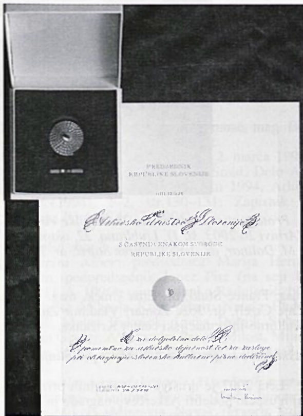
Častni znak svobode Republike Slovenije in listina o odlikovanju.

Ob 40-letnici je predsednik Republike Slovenije Milan Kučan Arhivskemu društvu Slovenije z ukazom z dne 14. julija 1995 podelil odlikovanje častni znak svobode Republike Slovenije. 76 Odlikovanje smo slovesno sprejeli 21. februarja 1996.