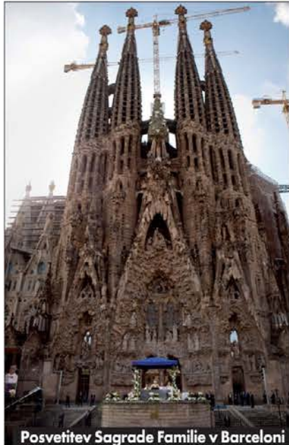
Posvečitev Sagrade Famílie v Barceloni

Posebno močne so bile njegove misli 6. t. m. v Komposteli, od koder je "kot romar med romarji" vso Evropo pozval, naj se odpre Bogu. Tragedija, ki se je v zadnjih dveh stoletjih razširila po celini, je po njegovih besedah v prepričanju, da je Bog nasprotnik človeka in sovražnik njegove svobode. Pri tem pa so pozabili, je pripomnil papež, da je Bog poslal svojega Sina na svet, da se ne bi nihče pogubil, ampak bi vsi imeli življenje. Ljudje ne moremo živeti brez luči, zato mora beseda Bog svetlo veselo odzvanjati pod evropskim nebom. Španijo in Evropo je pozval, naj gradi sedanost in načrtuje prihodnost na temelju pristne človekove resnice. Španija in Evropa, je rekel, nista zaskrbljeni za grotne potrebe ljudi, temveč za moralne in družbene, duhovne in verske, kajti le-te so pristne človekove potrebe. Romati ne pomeni le obiskati katerikoli kraj in občudovati njegove naravne, umetniške in zgodovinske zaklade. Romati pomeni - je poudaril sveti oče v Komposteli, ki se s posebnim