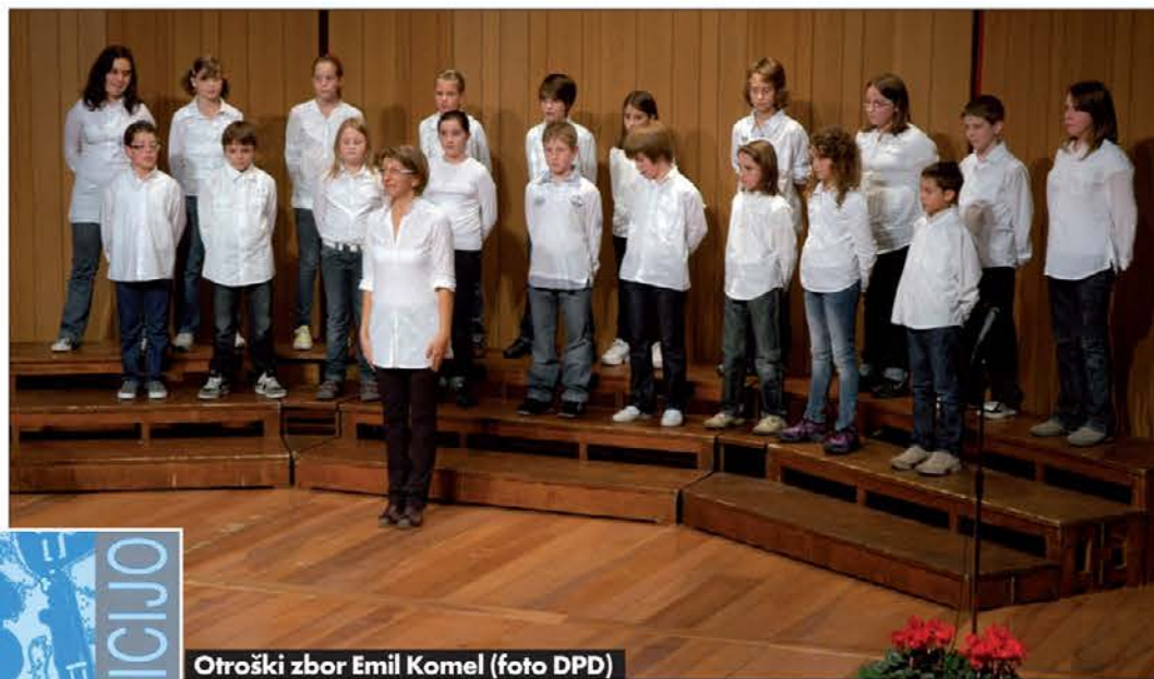
Otroški zbor Emil Komel

vseh žanrov, od simfoničnih skladb, oratorijev, maš, instrumentalnih in komornih skladb vse do zborovske literature v omenjenih različnih jezikih ter celo angleščini. Opus je priča trdega dela in iskrenega umetniškega iskanja, vezanega na tradicijo in odprtega v sodoben izraz. Njegov celotni opus v digitalni obliki in nekaj tehtnejših stvaritev v knjižni obliki predstavljajo prvi korak k spoznavanju in razširjanju dela tega zanimivega skladatelja, ki je - kot Emil Komel - iskal povezave med različnimi