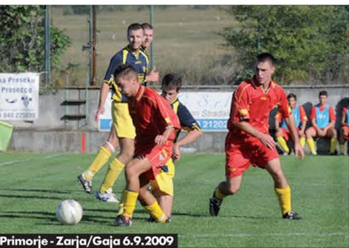
Primorje - Zarja/Gaja 6.9.2009

tednik v tisk... V lanskej sezoni, ko so svojega vodjo med sezono zamenjali tudi košarkarji Jadrana in Bora, so bile ugotovitve malce različne, ker se je pač modna muha razširila tudi na druge športe in se je nekako dalo posploševati. Letos pa se - z zdaj - z nenadnimi spremembami v tehničnem vodstvu pregovorno proslavljajo le žogobrcarji, ki so ta sistem uvedli in ga očitno tudi še naprej dosledno razvijajo. Zadeva je že dobro znana in preverjena, saj se zgodba ponavlja iz leta v leto. Julija prešerni nasmehi in objemu krmarja, ki so ga potrdili po prejšnji uspešni sezoni ali angažirali, potem ko je dosegel dobre rezultate pri sosednjem klubu in tako dokazal, da je sedaj najboljši na tržišču. Po pripravah izjave v slogu: trener je jamstvo, delamo dobro, rezultati ne bodo izostali, oziroma, novi vodja je odličnejši, vzpostavil je drugačen način dela, ki ga nogometaši odobravajo, predstavke za uspešno sezono so torej nedvomno pozitivne. Poletja je konec, začne se igrati za tri točke.