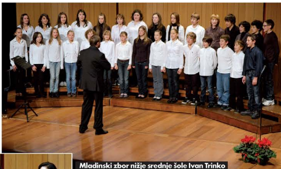
Mladinski zbor nižje srednje šole Ivan Trinko