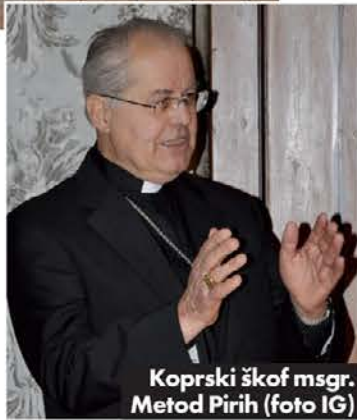
Koprski škof msgr. Metod Pirih

v škofijskem dvorcu koprski škof msgr. Metod Pirih. Koprski škof je prisotnim orisal preteklost najstarejše škofije na sedanjih slovenskih tleh. Msgr. Pirih je naglasil odnos s tržaško škofijo, s katero je bila koprška do leta 1977 povezana. Med drugim je poudaril odprta vprašanja, ki zadevajo zlasti vrnitev koprskе škofijskega arhiva iz Trsta (predhodniku msgr. Pirih, prvemu škofu na novo usta-