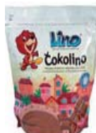
ČOKOLINO 1KG PODR. 6,99 EUR