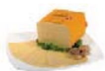
SIR EDAMEC MERCATOR 4,99 EUR/kg