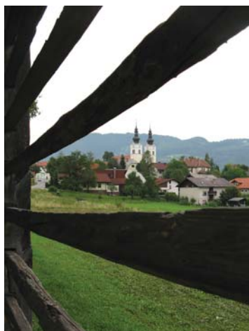
Fotografija na naslovnici: Moravče

Naslednja številka izide 26. septembra 2008. Vaše prispevke pričakujemo do 10. septembra.