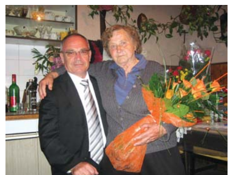
Vida Per , Detelova cesta 8