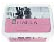
SLAD.PLANICA 1L LJUB.ML. 2,89 EUR