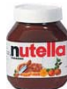
NAM.KREM. NUTELLA 750g 4,40 EUR