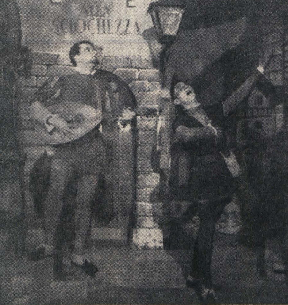
Držicev „Dundo Maroje“ na odru SNG