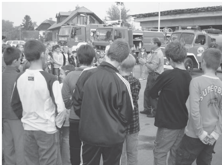
Razstava gasilske tehnike