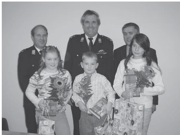
Nagrajenci skupaj z županom in vodstvom gasilske zveze

»Vesel sem, da se učenci na svoj način vključujejo v aktivnosti ob mesecu varstva pred požari – morda boste misli iz spisov prenesli na vrstnike in nenazadnje tudi na občane, ki bodo bolj preventivno poskrbeli za svoje domove. Morda se boste tudi vi nekoč pridružili gasilcem ali pomagali ljudem v stiski, kar se mi v družbi, ki stremi za materialnimi dobrinami, zdi ena najlepših vrednot