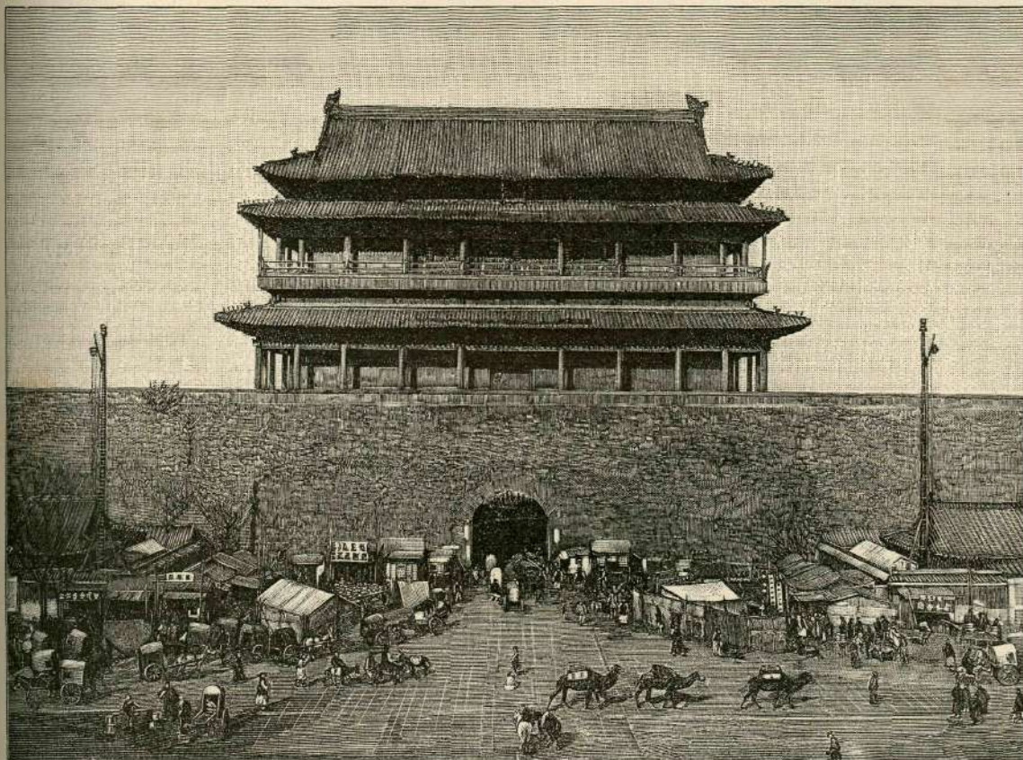
Glavna vrata v Pekingu.

štirideset let. A sedaj! Nova cev je bila trdna, zato je z zadovoljnostjo gledal svojo tepko-okovanko. Gotovo je pri tem mislil zopet na sina in na njegovo nespametno ženitev, a molčal je in miril v mislih sam sebe, češ, stori, kakor hočeš, kakor si boš postlal, tako boš ležal. In prikimal si je. Poslušal je dolgočasno, enakomerno ropotanje ropotca, ki je bil narejen na vse štiri sape in je