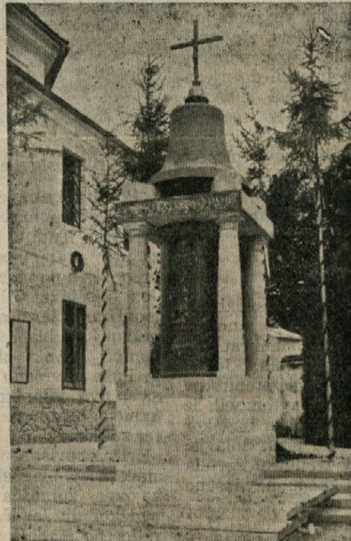
Spomenik padlim vojakom.

so tako pomembni v njegovi rasti in splošni njegovi zgodovini.