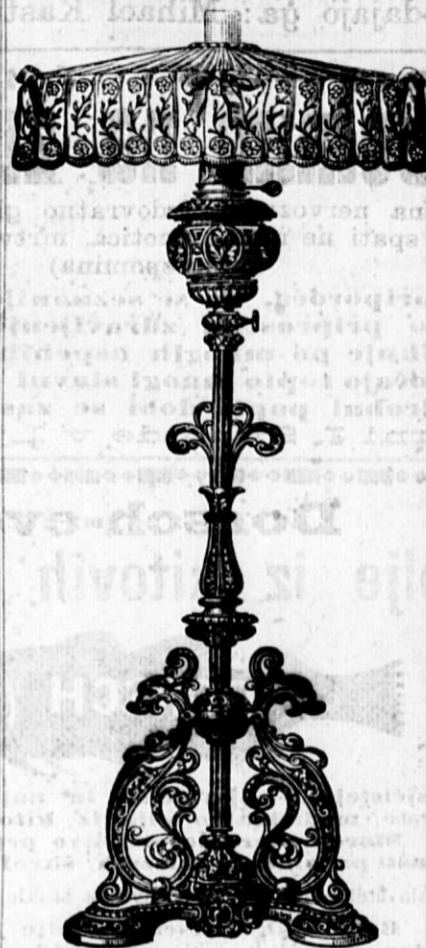
Svetilka s stojalom s čipkasto strešico.

Astralne svetilke se morejo zaradi posebne oblike lahko postaviti v razne svetilniške podstavke. (707-18)