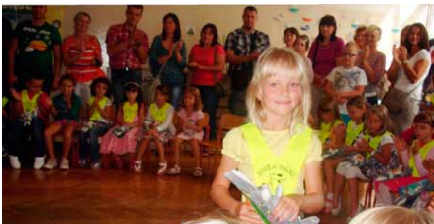
Prvošolci v svoji učilnici