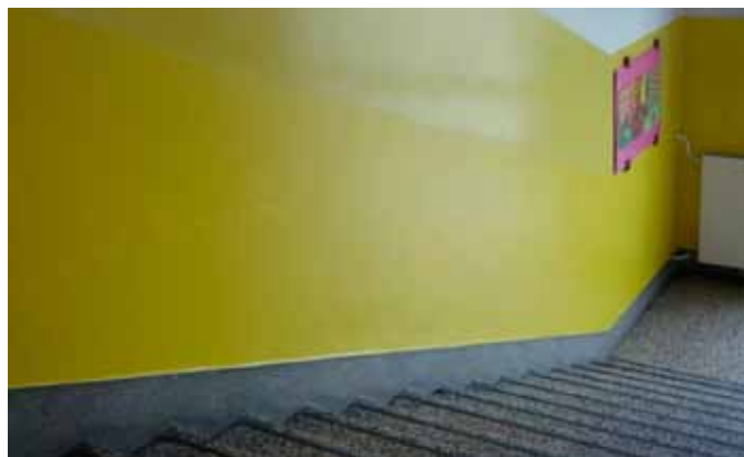
Prenovljen šolski hodnik