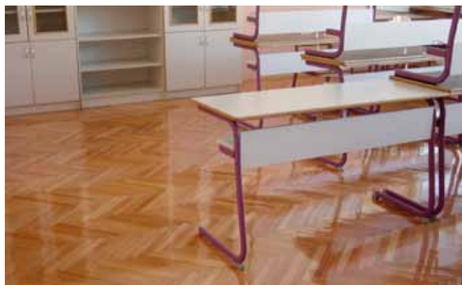
Obnovljen parket v učilnici 1. nadstropja