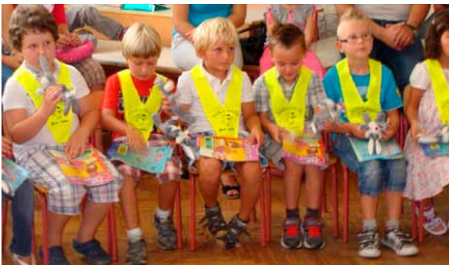
Prvošolci z rumenimi ruticami