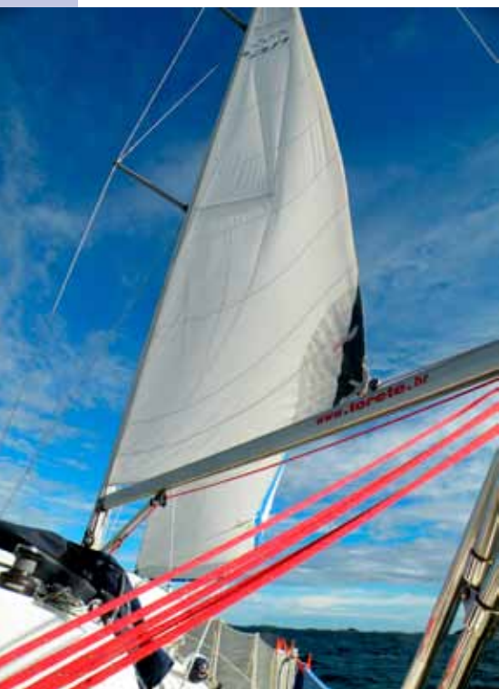
Preživljanje dopusta na jadrnici je svojevrsten užitek.