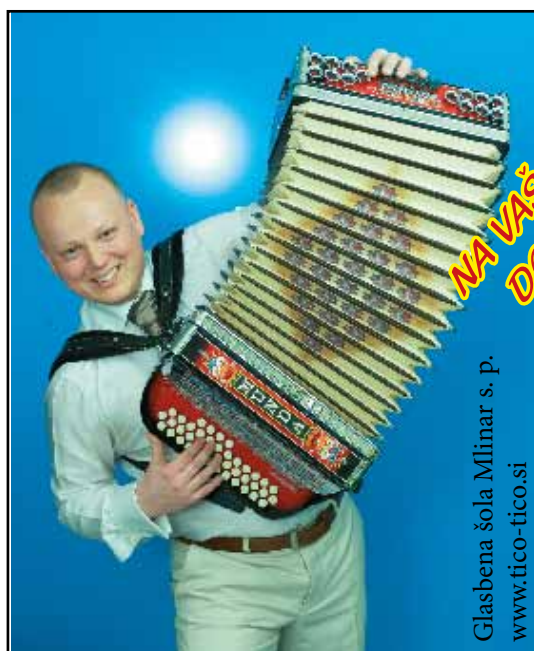
Glasbena šola Mlinar s. p. www.tico-tico.si

POUČEVANJE diatonične in klavirske HARMONIKE, SYNTHESIZERJA, BAS KITARE IN KITARE. Prodaja HARMONIK