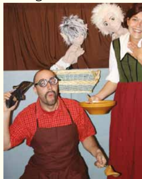
ČEVJAR IN PALČKA