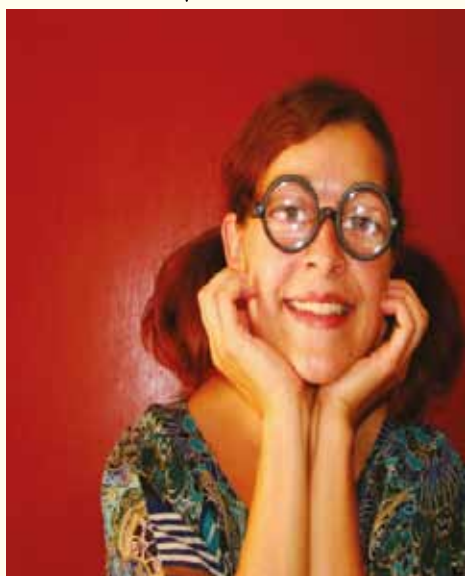
TINKA GRE V ŠOLO

Informacije: občina Štore 03/780 38 40, 031/367 889 tajnistvo@store.si