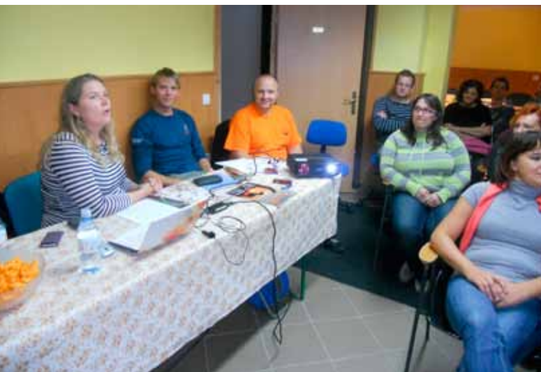
Na potopisnem večeru