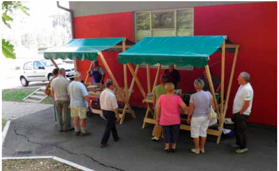
Utrip s tržnice v juliju

Žal pa krajani Štor oziroma Lipe niso pokazali dovolj interesa, da bi tržnica lahko delovala. Do nadaljnjega se zato tržnica ukinja.