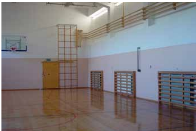
Obnovljen parket v telovadnici

V času počitnic so na šoli potekala nekatera obnovitvena dela: pleskanje velike telovadnice, pleskanje sten ob stopnišču od pritličja do 3. nadstropja, pleskanje sten na hodniku v 3. nadstropju, struganje in lakiranje v treh učilnicah v 1. nadstropju, v eni učilnici v 3. nadstropju in v štirih učilnicah v 2. nadstropju.