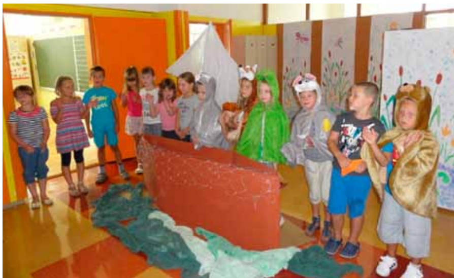
Druošolci v predstavi Bobek in barčica