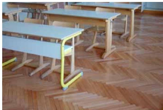
Obnovljen parket v učilnici 2. nadstropja

Glede na to, da šola ne bo več izdajala tiskane publikacije, bodo vse informacije o šoli in dejavnostih objavljene na naši prenovljeni internetni strani: http://784.gvs.arnes.si/cms/index.php?change_width=fluid .