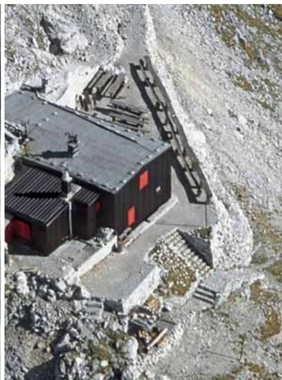
Zgoraj: Zračni posnetek Gomiščkega zavetišča. Stopnišče pod njim pojasni, da res stoji na temeljih Piccovega spomenika – zavetišča.