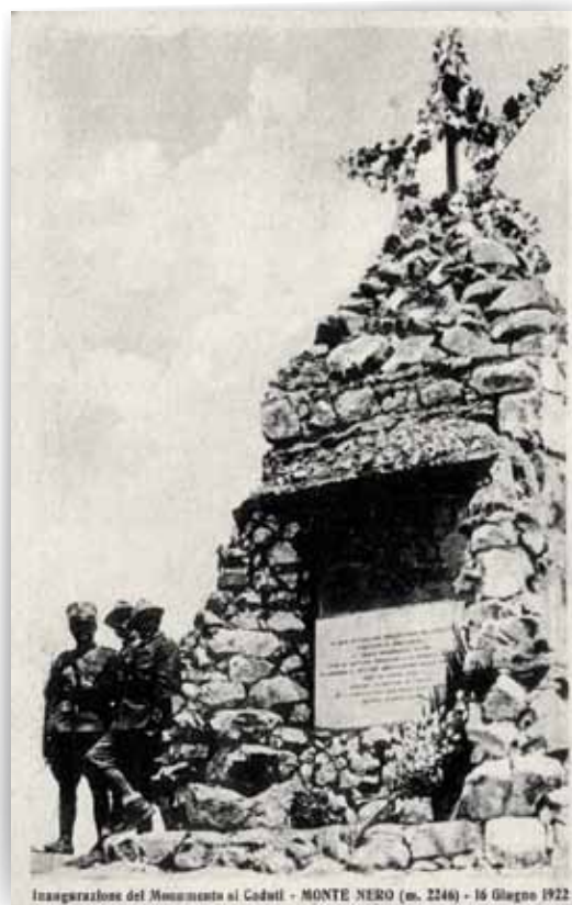
Prvo obeležje na Krnu, skalna piramida je postala žrtev strele, krivdo pa so po krivici pripisali domačim pastirjem.

Kmalu po vojni so na izpostavljenem vrhu Krna zgradili okoli šest metrov visoko kamnito piramido z vdolano napisno ploščo in veliko zvezdo na vrhu. Ob sedmi obletnici zavzetja, 16. junija 1922, je bilo načrtovano svečano odkritje spomenika, vendar jo je narava zbranim občudovalcem hudo zagodla. Le dan prej se