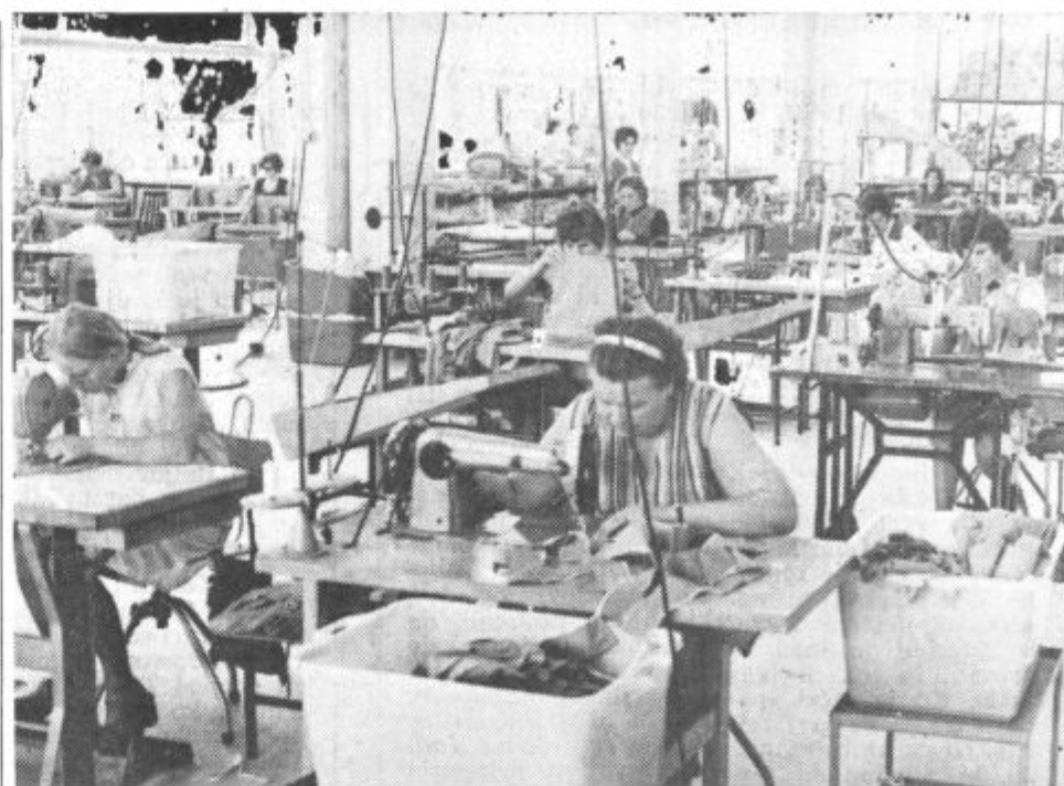
Nova sodobna šivalnica

V osnovni šoli Biba Röck Šoštanj so med počitnicami kar precej pohiteli z delom pri zgraditvi nove telovadnice, ki jo imenuje telovadnica solidarnosti, saj so jo zgradili z denarnimi