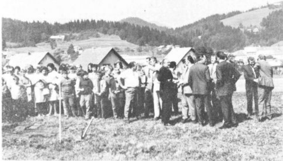
Takole so lani septembra zasadili prvo lopato na Štibu

razumljivo, da med drugim nima telovadnice. Sicer pa te ne premore nobena šola v Mislinjski dolini. Zato nas je zanimalo, kako dol-