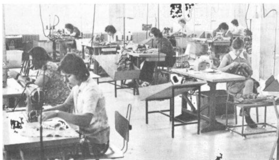
Modni salon Velenje slavi letos 10-letnico pripojitve h komunalno obrtnem centru Velenje. Ob jubileju so zgradili nasproti gostišča Rudar novo tovarno konfekcije, v kateri so pred dnevi že začeli poskusno proizvodnjo. Nova tovarna obsega 1090 kvadratnih metrov površin, poleg proizvodnih prostorov pa ima še jedilnico, v kateri bodo organizirali tudi tople malice. Sejna soba pa bo služila potrebam celotnega podjetja. Uradno otvoritev, ki bo ob občinskem prazniku, bodo združili z modno revijo. Daljši zapis o novi tovarni konfekcije objavljamo na tretji strani.

31. avgust 1973 • Leto IX., št. 24 (194) • Cena 1 dinar • Poština plačana v gotovini