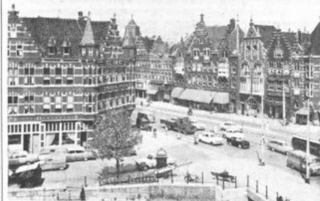
Lepe pozdrave iz Nizozemske pošilja velenjska skupina vam in bralecem. Smo udeleženci mednarodne izmenjave mladine. — Na razglednici: Rotterdam, Schiedamseweg.

Pismene ponudbe z dokazili o strokovni izobrazbi naj kandidati pošljejo v 15 dneh po objavi na komisijo za vstop in izstop z dela pri Industriji plastike »POLYPEX« Šoštanj, Cesta talcev 3.