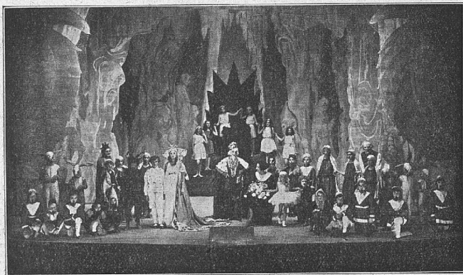
Igralci in avtorica „Zaromila“. (Glej poročilo na str. 247.)