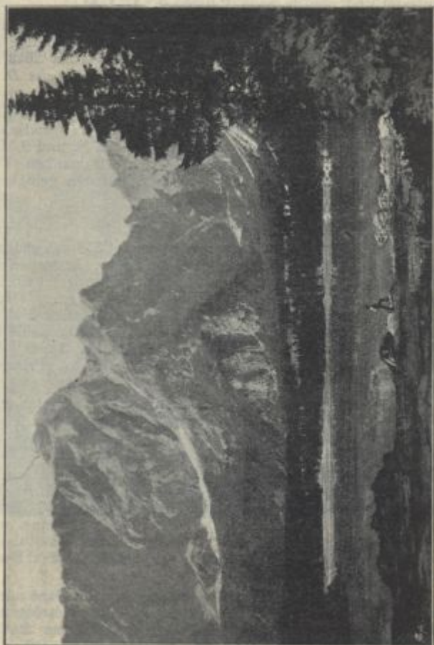
Weissenfelsen See II.

schaft Wurzen , 849 m [ Gsths. Rassinger ], von der ein Fahrweg über die Karawankenkette ins Untere Gailtal führt. Auch Wurzen ist eine besuchenswerte und beliebte Sommerstation.