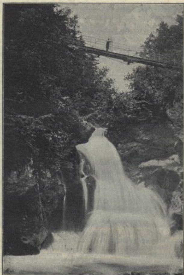
Rotweinfall bei Veldes.

Werksanlagen (Hochofen u. dgl. m.) der Krainischen Eisen- industrie-Gesellschaft.