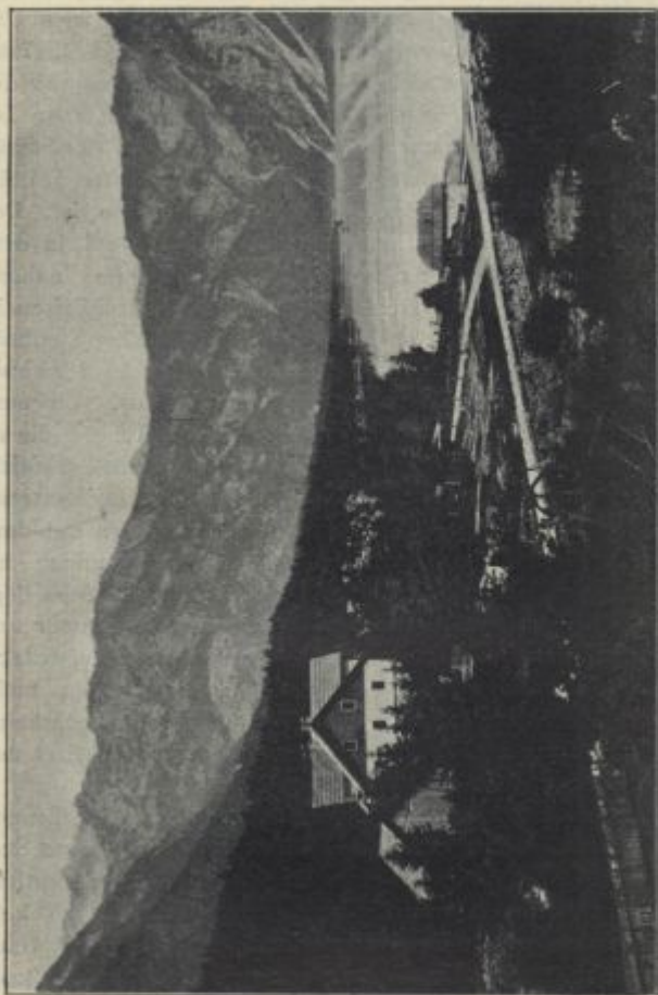
Wocheiner See-Hôtel St. Johann. Nach einer Photographie von Reinhold Langemann im Bad Veldes, Oberkrain .

Feistritz hierher in 1\frac{1}{2} St. Ghz., \frac{1}{2} St. Fhrz., d. i. von Veldes 6 St. Ghz., 3 St. Fhrz. oder von Station Lees-Veldes 7 St. Ghz., 3\frac{1}{4} St. Fhrz.