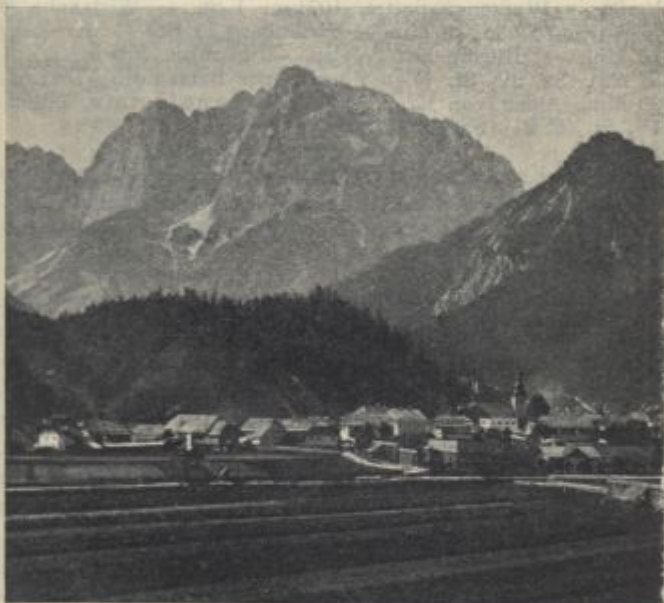
Kronau gegen das Pischenza-Tal.

Julischen Alpen vom Save- ins Isonzotal. Von Kronau im Pischenzagraben nach S. aufwärts zum 1\frac{1}{2} St. Talschluß, 1037 m, hier in dem nach r., südwestl. aufwärts ziehenden Talast (jener nach SO. verläuft bei den unzugänglichen Steilwänden des Razor) auf Steig bequem hinan auf den 1\frac{3}{4} St. Veršec(Moistroka)paß, 1616 m (zwischen Prisanig , 2555 m, im SO. und Moistroka , 2367 m, im W. Voßhütte mit Sommerwirtschaft der Sektion „Krain“ des D. u. Ö. A.-V. (Beide Spitzen