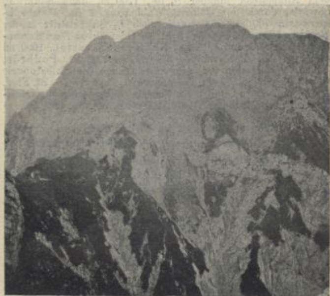
Kankersattel mit Zoishütte und Greben.

Prsz. 13 Min. Station Bischoflack , 9 km [Schankwirtschaft nächst der Station]. Der stattliche Markt Bischoflack, 350 m [Gsthser.: „Stemmerhof“; Gusel; Sorš; ferner: „Krone“: „Grüner