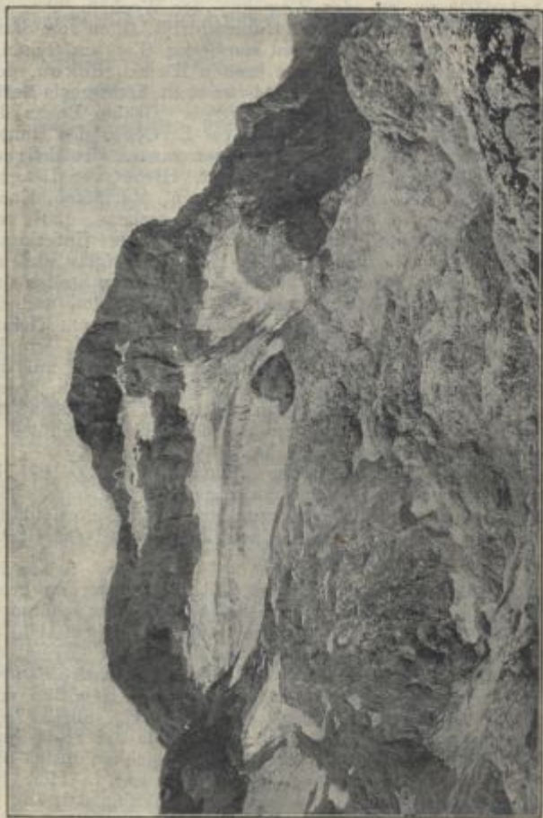
Triglavspitze vom Deschmannhaus.

etwas östl. im Walde eine Quelle und ein Wassertümpel. Der Pfad wird jetzt steiniger und stellenweise geröllig, wir steigen bald in der Oberen Kerma auf einem Felsensteig