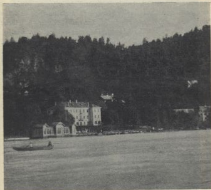
Luisenbad in Veldes.

Von der Station Lees-Veldes, 496 m, führt die Fahrstraße über die Bahn hinüber, beim Gsths. „Zum Triglav“ vorbei, nach W., senkt sich dann bald hinab zur Wurzener Save, welche auf hölzerner Brücke, 430 m Seehöhe, überschritten wird; jenseits am l. Ufer, die Save verlassend, steigt die Straße wieder an, wir passieren einen kleinen Wald, erreichen