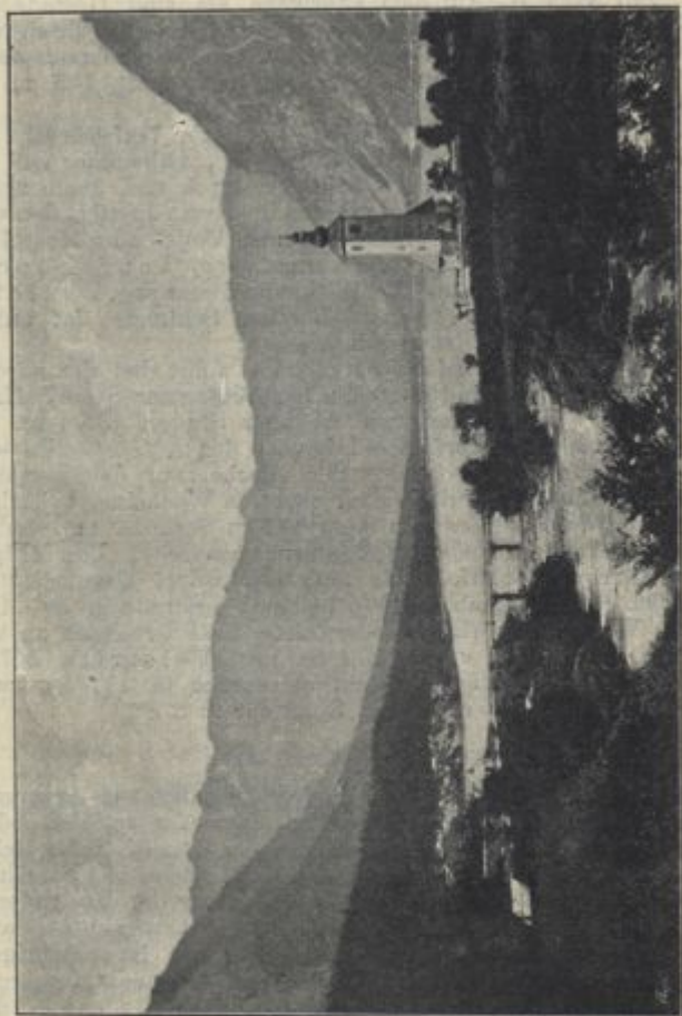
Wocheiner See.

Gleichfalls ganz nahe dem Hotel ist eine Badeanstalt im See errichtet, und stehen Kielboote und Kähne den Reisenden zu genußreicher Seefahrt zur Verfügung. Fünf