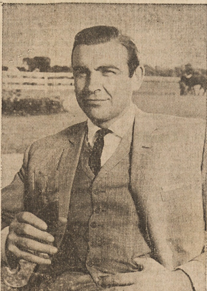
SEAN CONNERY je opustil svojo vlogo Iana Fleminga v vojnem filmu Agent 007. Prevezel jo je Roger Moore (na levi), ki bo igral Jamesa Bonda v novem filmu "Živi in pusti umreti". Moore je znan po svoji vlogi "Svetnika".