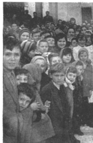
Otroci v pričakovanju dedka Mraza