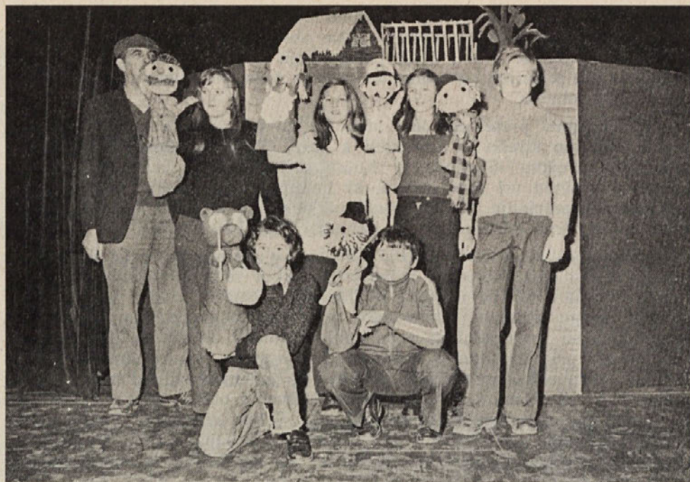
LUTKOVNA SKUPINA OB UPRIZORITVI IGRICE MEDVEDEK NA OBISKU LEOPOLDA SUHODOLČANA. Z NJO SO SODELOVALI NA V. SREČANJU LUTKARJEV V SEVNICI

ki izrazite poteze, ki poudarjajo njen značaj, tako da otrok že na prvi pogled spozna, kaj lutka predstavlja,« pravi tovariš Glad.