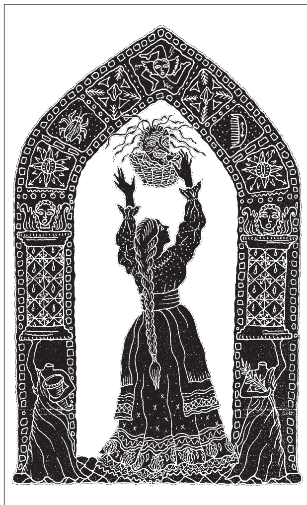
Figure 4: The Robber with a Witch's Head [ATU 302+311+621], illustrated by Joellyn Rock (Zipes, 2004, 40)

Razbojnik sa vješticijom glavom [The Robber with a Witch's Head] i priređeno od strane Jacka Zipesa, sadrži 42 priče, od čega je 30 bajki. Zipes je priredio i objavio 2005. godine još jednu zbirku bajki iz istih izvora. Naslov te druge zbirke je Preljepa Angiola [Beautiful Angiola] i ona sadrži još 94 priče (Blažič, 2006). U ovom tekstu bavićemo se samo prvom zbirkom, jer je korpus priča bogat. Conzenbach je bajke zapisala na Siciliji, koja je u doticaju istočnjačkog i zapadnjačkog metanarativa. Recimo, u priči Dvanaest razbojnika [The Twelve Robbers, ATU 676] pećina u kojoj razbojnici kriju blago obezbijedena je orijentalnim principom „ Sezame, otvori se! “, a u bajci Lijepa djevojka sa sedam velova [The Beautiful Maiden with the Seven Veils, ATU 408+884] očita je orijentalna mistifikacija ženske ljepote.