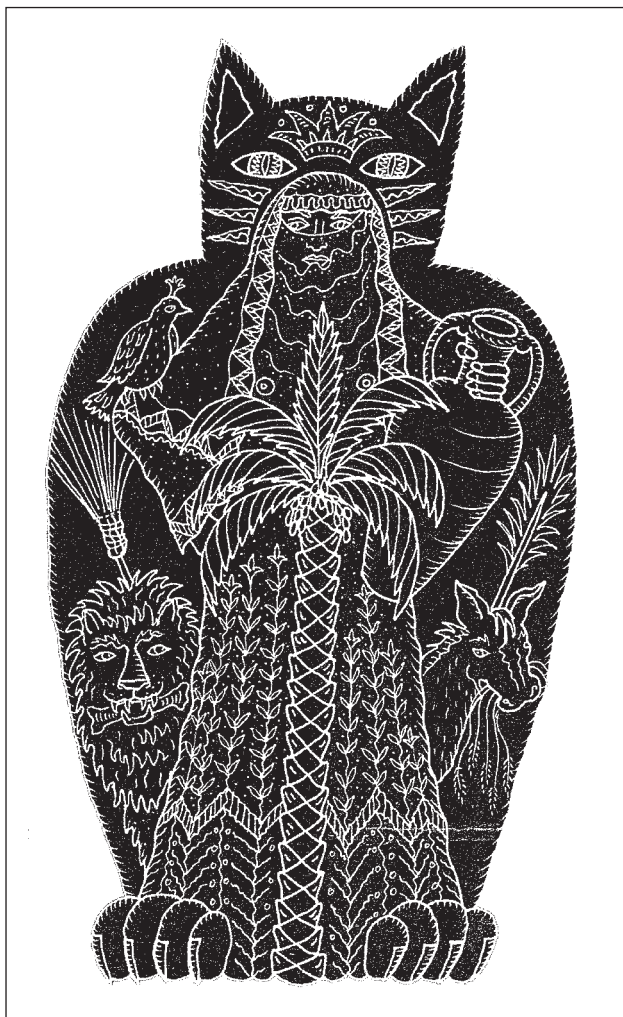
Figure 3: The Beautiful Maiden with the Seven Veils , illustrated by Joellyn Rock (Zipes, 2004, 55)