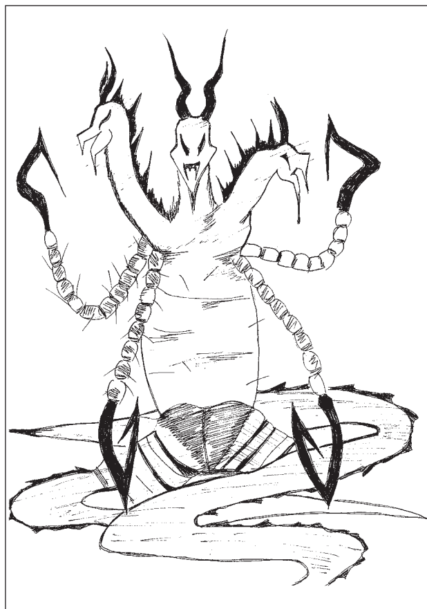
Figure 1: Azi-Dahaka, illustrated by Jelena Mašnić, 2017

U nekim pričama prepliće se i krišćanski motivacioni spektar, pa se anđeli javljaju u snu ili se čovjeku sugerira da se pomoli Bogu prije nego što počne nešto raditi itd. Sličnih elemenata ima i u italijanskim zbornicima. Ove su priče po elementima čudesnog bajke, a religiozni je duh prisutan, ali ne i sveprožimajući. Postoji nekoliko priča u kojima đavo ima ulogu, no, taj je lik dobio obrise zlog čarobnjaka, te oko njega nije biblijski pakleni ambijent. Recimo, u bajci Đavo i njegov šegrt [ATU 325] ima podteksta krišćanske religije, ali je priča njome prožeta „na narodnu“, pa dijete uči zanat od đavola, tj. uči kako koga da prevari. Đavo se u jednom trenutku preobražava u Turčina, što