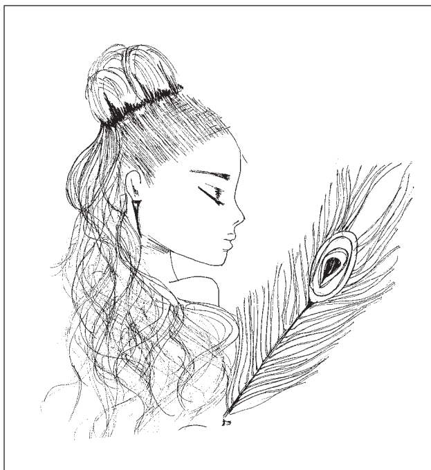
Figure 2: Peahen, illustrated by Jelena Mašnić, 2017

oteta tek nakon što stasa u momka i oženi se. U obje priče zmijski je junak moćan i povezan sa blagostanjem. U prvoj verziji, nakon što mu majka i supruga sagore zmijsku košulju, on ostaje kao divan čovjek. U drugoj priči, nakon oduzimanja košulje, uslijedi pripovijedanje paralelno mitu Cupid i Psyche , tj. mladi čovjek nestane, a dragana ga traži dok ne podere гвозdenu obuću.