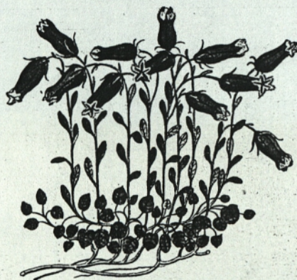
Campanula Zoysii Jacq. Coll. vol. 2.

Prirodoslovni muzej Slovenije je iz zapuščine Karla Zoisa dobil najstarejši znani herbarij na Slovenskem. Leta 1696