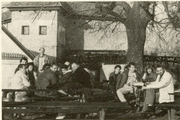
V zavetju stoletne lipe po napornem vzponu...