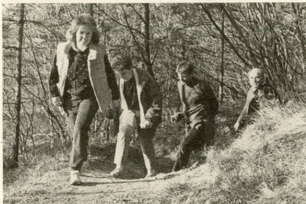
Z vseh strani so napadali vrh gore...