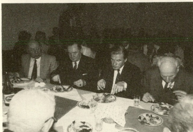
Tudi del starega vodstva se je zbral...