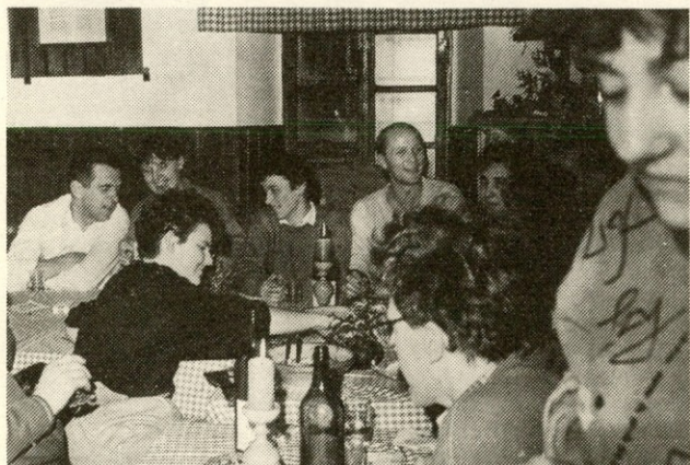
Čim bolj je dan tonil v večer, je razpoloženje raslo...