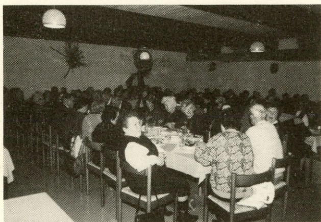
Ponovno zbrani pri skupni mizi — veliko nas je...