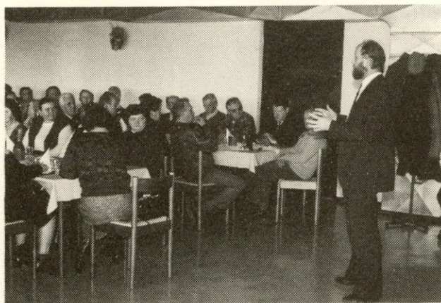
Prisluhnimo — izvedeli bomo kaj novega o podjetju...