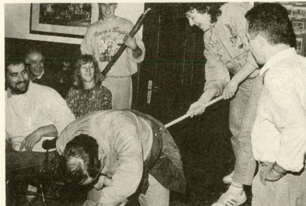
Za prvopristopnike je ob škodoželjnih nasmehih gledalcev poskrbel rabelj...