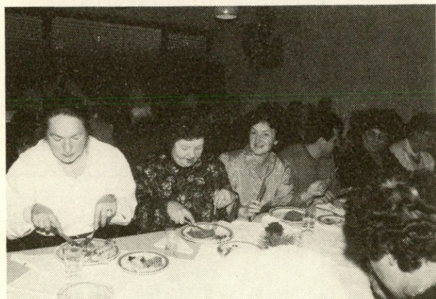
Mladenke — ni kaj reči...