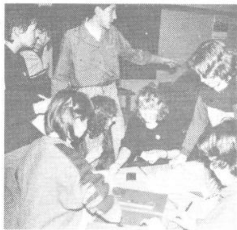
Tabornice vrisujejo kontrole točke v zemljevid