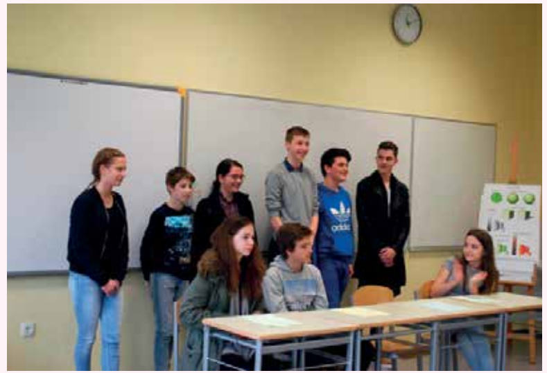
Predstavitve izvoljenih predstavnikov in poročanje sklepov.