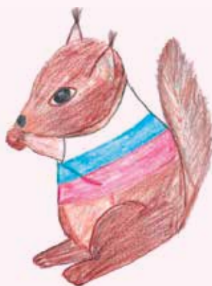
Maskota veвериček Rusko.

Na začetku poti je kamnito obeležje, postavljeno leta 2009 na pobudo ljubiteljev Ruske steze. Ob 1224 metrov dolgi stezi se nahajajo tudi energijske točke in tri sekvoje; to je tujerodna vrsta iglavcev, ki je v Sloveniji redka in zaščitena.