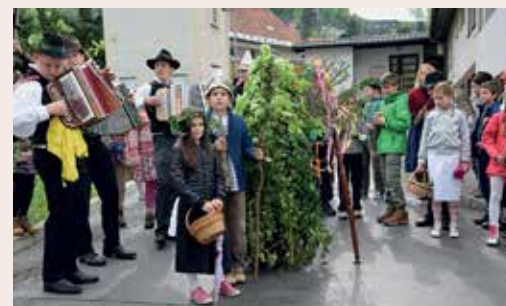
Jurjevanje leta 2015.