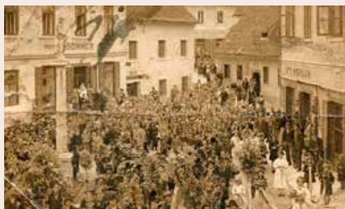
Jurjevanje v Laškem leta 1934.

Rubriko pripravlja Osrednja knjižnica Celje v sodelovanju z Zvezo kulturnih društev Možnar občine Laško