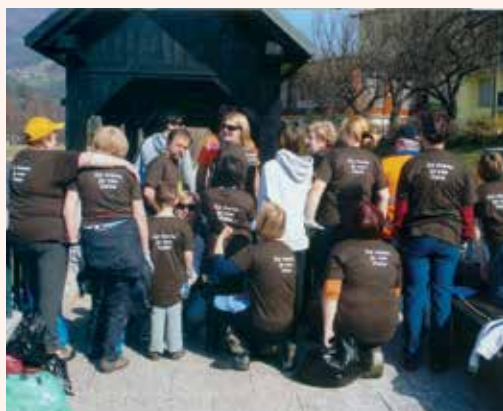
Tudi letos bo za nami vse čisto! (Fotografija čistilne akcije v letu 2012)

Vabljeni na čistilno in olepševalno akcijo v soboto, 23. aprila 2016. Zberemo se na parkirišču Kulturnega centra Laško ob 14. uri. Čistili bomo širše območje mesta Laško. Zaključek čistilne akcije z druženjem sodelujočih bo na vrtu Savinje. Vabljeni vsi, ki bi radi pripomogli k lepšemu izgledu našega mesta.