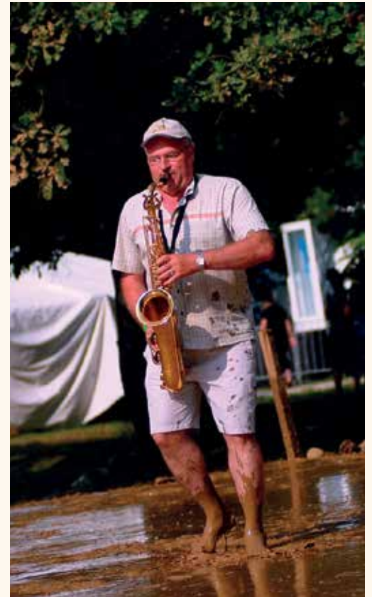
Medo, ujet v objektiv na Rock Otočcu, kjer je leta 2010 gostoval z Vaško godbo Vrh.

ko tudi zaključil. Kot je povedal takrat, je bil tisti večer oz. dogodek v decembru 2015 morda res njegov zaključni, a v kulturi še gotovo dolgo ne zadnji. Takrat so mu prav posebno presenečenje pripravili predstavniki STIK-a, ki so se mu ob upokojitvi s torto v obliki medveda zahvalili za ves trud, ki ga je ta leta vlagal v delo na kulturnem področju.