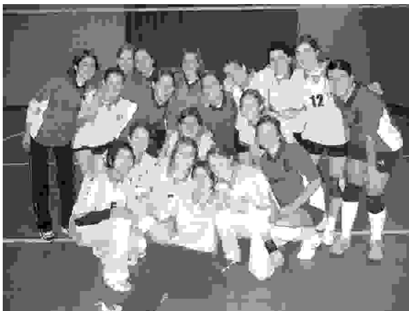
Preljubo veselje! Domača ekipa in obisk iz Pristave za dekli ko odbojko

primerni glasbi. A zabave je bilo kmalu konec, ko je domov pripel maček-mojster slikar (Luka Skale) in v slikarski delavnici napravil red. Hitro je začel barvati sliko, ki naj bi jo predstavil na risarskem natečaju. A zmanjkalo mu je domipijije. Začel je s primarnimi barvami, nadaljeval s sekundarnimi. Otroci Rožmanove pole so ga s plesom Narobe svet popeljali v otroške dni. Portretiral je mladce in mladenke, ki so prikupno zaplesali. Bela barva mu je svetovala, naj si zamisli kak slovenski motiv ob barvah slovenske zastave. Slikar je