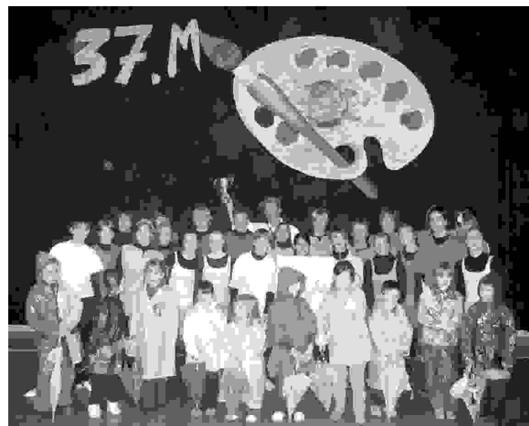
Vsi nastopajoči po končnem pozdravu