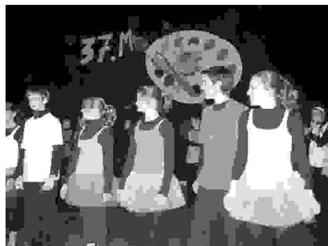
Prizor je bil res prijeten

Ko so nas opoldne sončni žarki lepo ogrevali, so mladi pohiteli v kapelo Srca Jezusovega, da bi se pri sv. mapi še duhovno ogreli. Sv. mapa