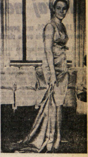
Model sovjetske večerne obleke

Letos kar noče biti konca modnih revij in novosti, ki jih modni eksperti tako v Franciji kot v Italiji, pa tudi v drugih državah, nenehno organizirajo in izpovedujejo. Mislije smo že, da smo povedale vse, kar se o letošnjih modnih novostih povedati da ter da smo v glavnem nakazale tudi vse smernice novih linij in krojev, pa smo se zmotile. Nove modne revije tako v Italiji kot v Franciji kažejo, da se smernice letošnje ženske mode še niso ustalile ter da je še mnogo novega in posebnega, kar bodo morale ženske vedeti in spoznati, če bodo hotele svojo garderobo za jesen in zimo prilagoditi direktnam letošnje mode.