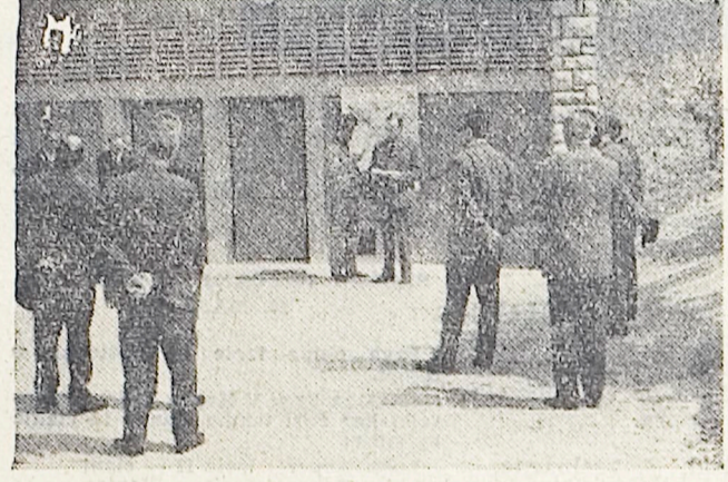
Nad Portorožem je Rižanski vodovod pred časom, kakor smo že poročali, izročil namenu velik vodohram, ki naj za daljšo dobo zagotovi našemu največjemu turističnemu središču tudi v poletnih sušnih mesecih dovolj vode...