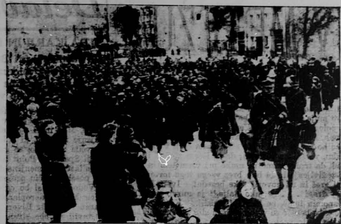
Junaški branitelji poljske prestolice Varšave se po treh tednih vročih bojov predajo sovržniku. — Slika je šele sedaj prišla iz Evrope.

vžgalice" je veljal samo $1.50 in ga je bilo mogoče pustiti odkrito na mizi. Prstan z majhnim zrcalom na notranji strani roke je veljal $5.00.