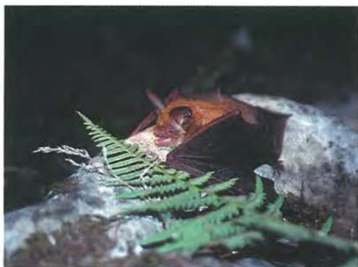
Slika 1: Veliki navadni netopir ( Myotis bechsteinii ) je v Evropi redka in ogrožena vrsta, ki prebiva v zrelih gozdnih sestojih

Netopirji ( Chiroptera ) so samostojen red sesalcev, ki je po številu vrst takoj za glodalci. Vse tri v Evropi živeče družine spadajo v podred malih netopirjev ( Microchiroptera ). Pri nas žive predstavniki dveh družin: podkovnjaki ( Rhinolophidae ), ki imajo okoli nosnic značilne kožne tvorbe, in pripadniki družine gladkonosih netopirjev ( Vespertilionidae ), ki teh tvorb nimajo.