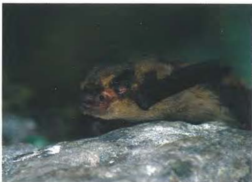
Slika 2: Gozdni mračnik ( Nyctalus lesleri ) je gozdni netopir, katerega razširjenost je pri nas še slabo poznana

Netopirji so edini sesalci, zmožni aktivnega leta, ki ga omogoča tanka, elastična opna, razpeta med podaljšanimi prednjimi okončinami, trupom in repom. Pri njih se je razvil poseben način orientacije z zvokom – eholokacija. S pomočjo oddajanja in sprejemanja visokofrekvenčnega zvoka si lahko ustvarijo natančno sliko okolice in položaja plena. Evropske vrste netopirjev so v vrhu prehranjevalne verige, večinoma se prehranjujejo z žuželkami, katerih aktivnost pa je v zmernih klimatih omejena na toplejše dele leta. Preživetje hladne zime brez hrane jim omogoča pravo zimsko spanje (hibernacija), ko se metabolizem zelo upočasni, telesna temperatura pa lahko pade na nekaj stopinj nad zmrziščem. Pogosto vznemirjanje in posledično zburjanje živali v tem času lahko povzroči, da prekomerno porabljajo energetske zaloge, ki jih v hladnem obdobju ne morejo nadomestiti, zato lahko še pred prihodom pomladi poginejo. Zaloge rjavega maščevja si nabirajo med intenzivnim prehranjevanjem jeseni. Takrat pri njih poteka tudi parjenje, ob čemer se je razvila odložena oploditev kot še ena prilagoditev za preživetje hladnega obdobja. Samice spermo shranijo v poseben del maternice, dejanska oploditev in razvoj zarodka pa se pričneta po končani hibernaciji, ko toplo okolje zopet omogoča prehranjevanje in s tem tudi skrb