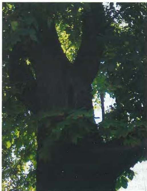
Slika 3: Drevesna dupla predstavljajo primarno zatočišče mnogih vrst netopirjev, zato je njihovo ohranjanje izrednega pomena

Netopirji so edini sesalci, zmožni aktivnega leta, ki ga omogoča tanka, elastična opna, razpeta med podaljšanimi prednjimi okončinami, trupom in repom. Pri njih se je razvil poseben način orientacije z zvokom – eholokacija. S pomočjo oddajanja in sprejemanja visokofrekvenčnega zvoka si lahko ustvarijo natančno sliko okolice in položaja plena. Evropske vrste netopirjev so v vrhu prehranjevalne verige, večinoma se prehranjujejo z žuželkami, katerih aktivnost pa je v zmernih klimatih omejena na toplejše dele leta. Preživetje hladne zime brez hrane jim omogoča pravo zimsko spanje (hibernacija), ko se metabolizem zelo upočasni, telesna temperatura pa lahko pade na nekaj stopinj nad zmrziščem. Pogosto vznemirjanje in posledično zburjanje živali v tem času lahko povzroči, da prekomerno porabljajo energetske zaloge, ki jih v hladnem obdobju ne morejo nadomestiti, zato lahko še pred prihodom pomladi poginejo. Zaloge rjavega maščevja si nabirajo med intenzivnim prehranjevanjem jeseni. Takrat pri njih poteka tudi parjenje, ob čemer se je razvila odložena oploditev kot še ena prilagoditev za preživetje hladnega obdobja. Samice spermo shranijo v poseben del maternice, dejanska oploditev in razvoj zarodka pa se pričneta po končani hibernaciji, ko toplo okolje zopet omogoča prehranjevanje in s tem tudi skrb