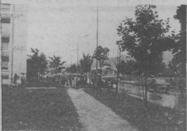
Jesenski dež, solarji s starši in avtobus.