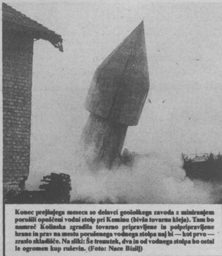
Konec prejšnjega meseca so delavci geološkega zavoda z miriranjem porušili opuščen vodni stolp pri Kemisu (bivša tovarna kletja). Tam bo namreč Kolinska zgradila tovarno pripravljene in polpripravljene hrane in prav na mestu porušene vodnega stolpa naj bi — kot prvo — zraslo skladišče. Na sliki: še tresutek, dva in od vodnega stolpa bo ostal le ogromen kup ruševin.